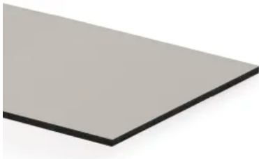
Duropal XTerior compact - einseitige Lackierung

Duropal XTerior compact - beidseitige Lackierung