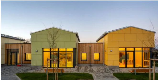
Robuste Lösung mit XTerior compact

Aus der Serie Außenanwendung von Pfeiderer Deutschland