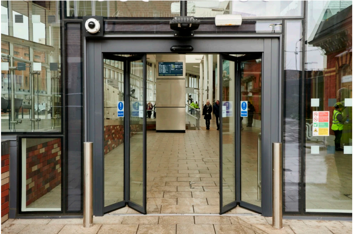
Record FTA 20 – automatische Falttüren

Aus der Serie Automatische Türsysteme von Record Türautomation