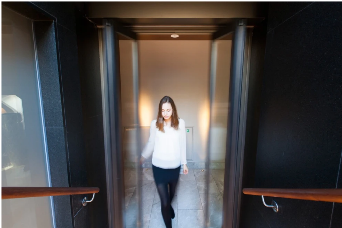
Record FTA 20 – automatische Falttüren

Die Durchgangsbreite kann dabei nahezu voll erhalten bleiben. Eine automatische Falttür lässt sich einfach nachrüsten und bauartbedingt besonders gut in Korridore integrieren. Abhängig von der Gesamtbreite wird die Falttür dabei als ein- oder beidseitige Variante verbaut.