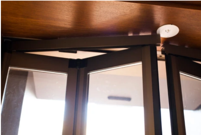
Record FTA 20 FBO mit mechanischer «Break-out»-Funktion (FBO)

Aus der Serie Automatische Türsysteme von Record Türautomation