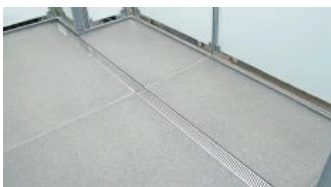
Bakodur® E Holzzement-Gefälleplatten mit Ablaufrinne