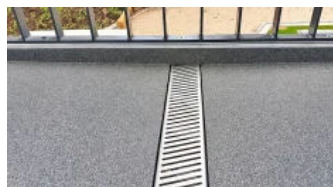
Bakodur® E Holzzement-Gefälleplatten mit Ablaufrinne