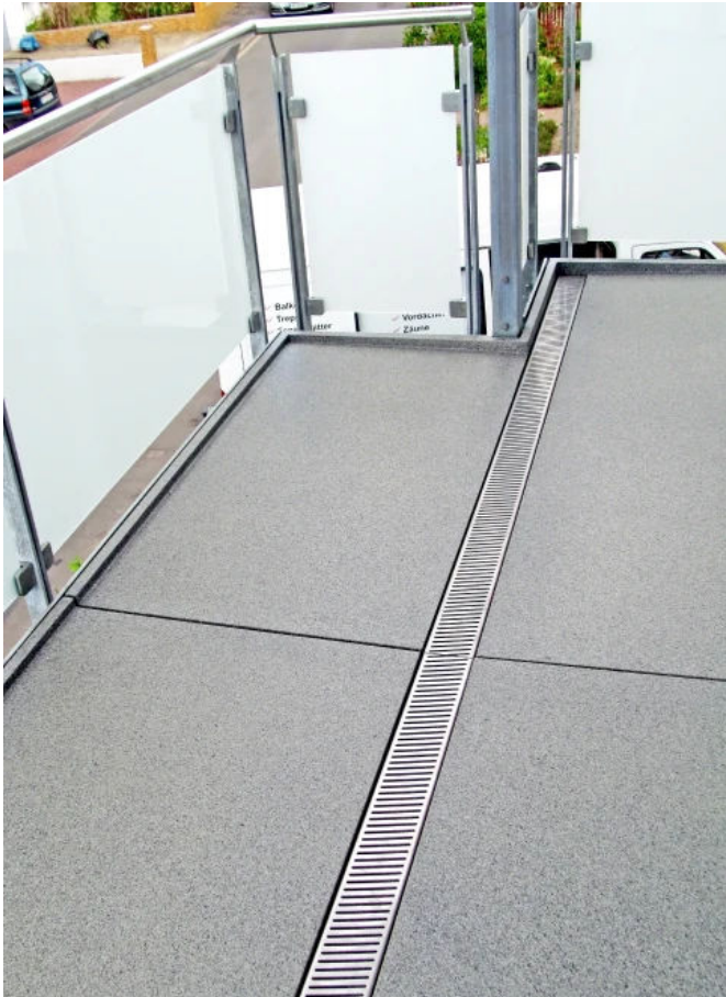
Bakodur® E Holzzement-Gefälleplatten

Entwässerung der Balkonfläche: BALKODUR® E ergänzt das BALKOPLAN® System und gewährleistet eine gesicherte Entwässerung von Balkonflächen. Die Laufflächen sind mit 2% Gefälle zur Entwässerungsrinne hin ausgebildet, damit das anfallende Oberflächenwasser zielgerichtet in die Rinne geleitet wird.