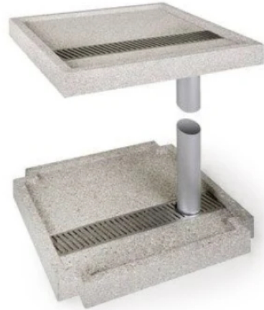
Bakodur® E Holzzement-Gefälleplatten