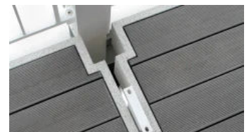
Detail Bakodur® E mit Terrassendielen