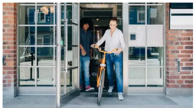
Comfort-Plan® ist geeignet für Außentüren im barrierefreien Neubau sowie nachgerüstet im Altbau oder nach einer Sanierung.