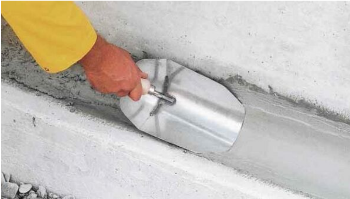
Flex Dichtschlämme, Dichtschlämme, Hohlkehlepachtel, Wassersperrputz und Stopfmörtel

Aus der Serie Bautenschutz / Abdichtung von Saint-Gobain Weber