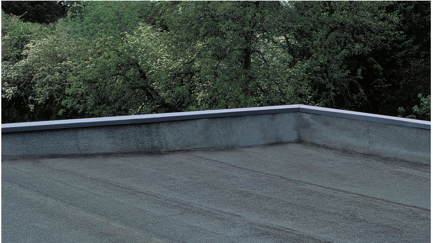
Voranstrich und Reflexionsschutzanstrich

Aus der Serie Bautenschutz / Abdichtung von Saint-Gobain Weber