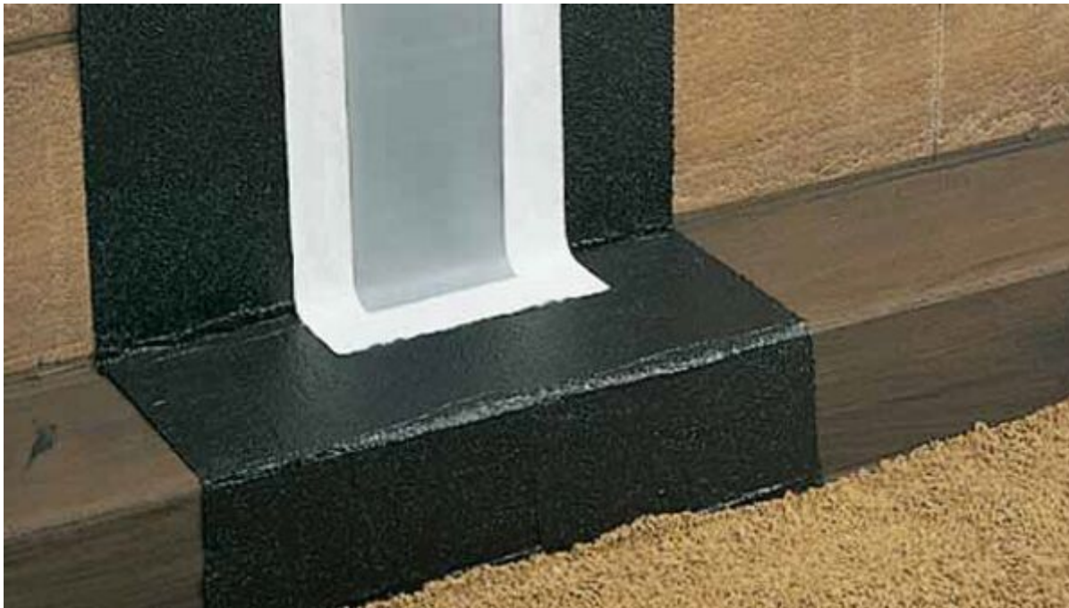
Fugenabdichtband, Dichtfolie, Dränmatte

Aus der Serie Bautenschutz / Abdichtung von Saint-Gobain Weber