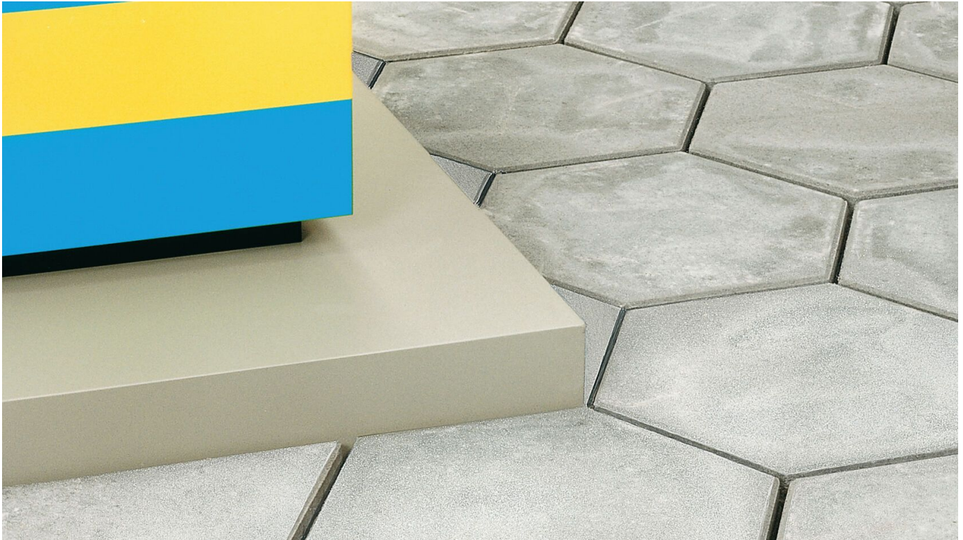
Tankstellendichtstoff, Primer, Industriefuge

Aus der Serie Bautenschutz / Abdichtung von Saint-Gobain Weber