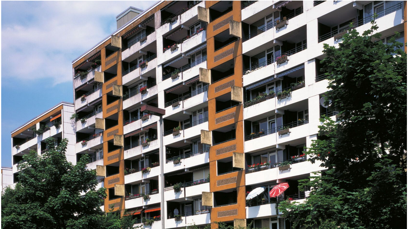
Universal-Bauharz, Balkonbeschichtung, Balkonversiegelung, EP-Grundierung, EP-Versiegelung und EP-Beschichtung

Aus der Serie Bautenschutz / Abdichtung von Saint-Gobain Weber