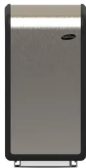
Toilettenpapierspender XIBU METAL TISSUEPAPER hybrid