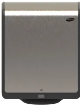
Papierhandtuchspender XIBU METAL TOWEL hybrid