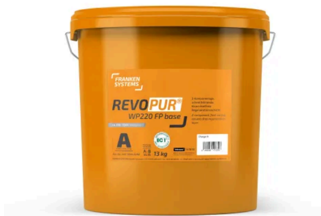
REVOPUR® WP220 FP

Aus der Serie Abdichtungen und Beschichtungen von FRANKEN SYSTEMS