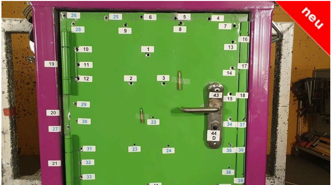
Einflügelige beschusshemmende Tür nach EN 1522/1523

Aus der Serie Türen und Tore mit Drehflügel von System Schröders Türen + Tore