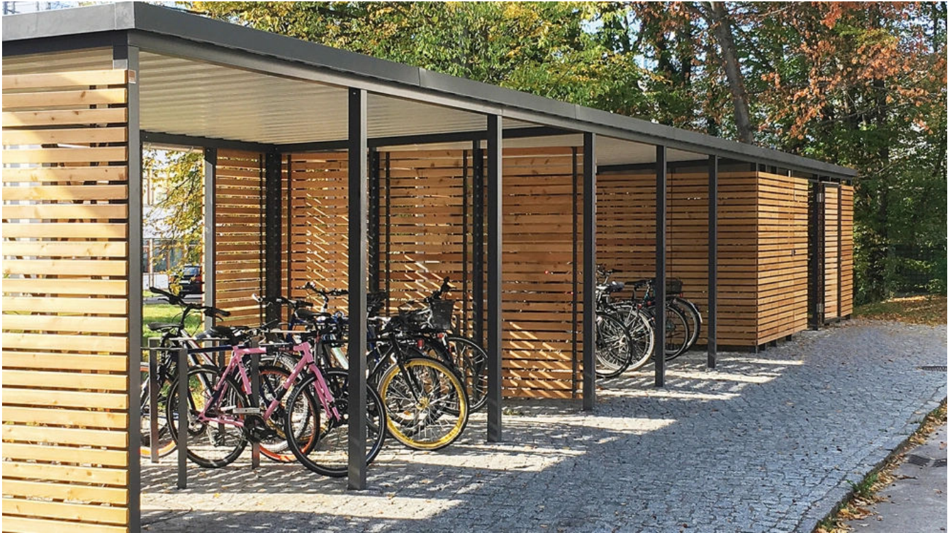
Bikeport und Einhausung, Holz (Lärche)

Aus der Serie Überdachungen von Gerhardt Braun