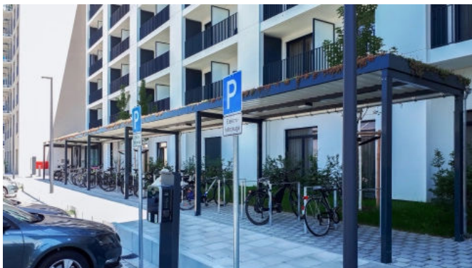
Bikeport, ohne Füllung