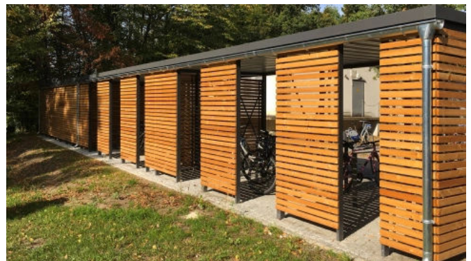
Bikeport, Holz (Lärche)