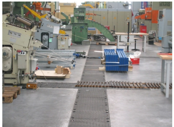
BIRCOcanal® in einem Automobilzulieferbetrieb,