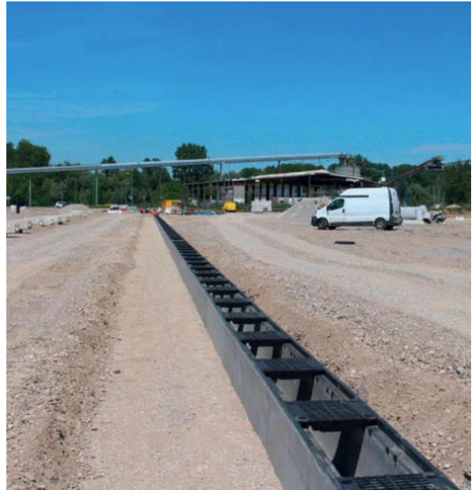
Anwendungsbeispiel: Einbau der Typ-I-Bauteile – Hafen Lauterbourg / Strasbourg