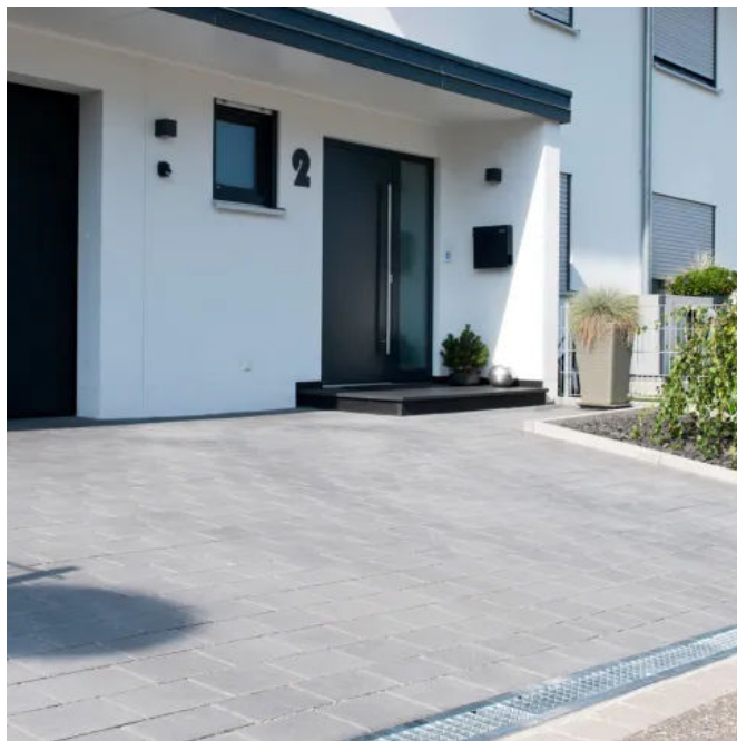
BIRCOplus Entwässerungsrinne vor Garageneinfahrt