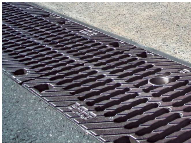
BIRCOprotect Absperrsinkkasten – Sicherheit im Havariefall