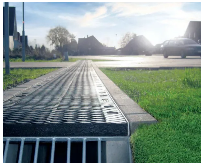
BIRCOsir® Entwässerungsrinnen mit großen Nennweiten