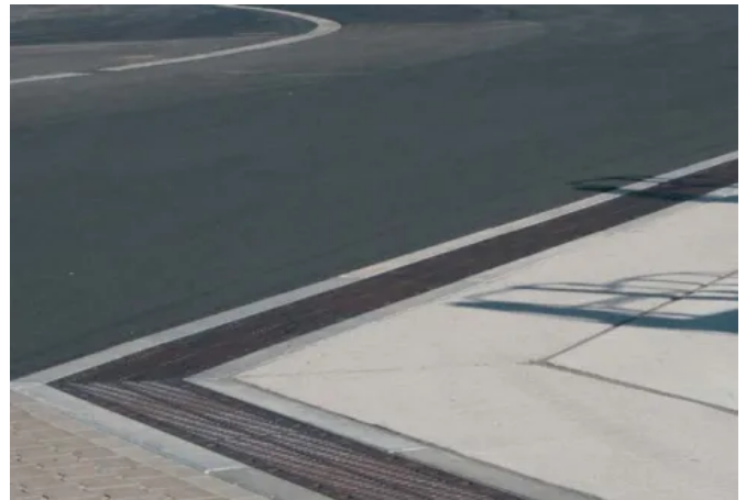
BIRCOsolid® Kastenrinnen – Sicherheit und Stabilität mit bauaufsichtlicher Zulassung