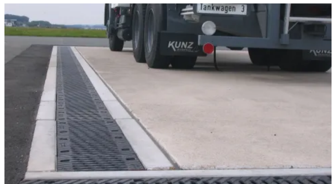
Das BIRCOsolid® Kastenrinnensystem gewährleistet optimale Dichtigkeit gegen Flüssigkeiten wie Kraftstoffe, Öle, schwache Laugen und Säuren.