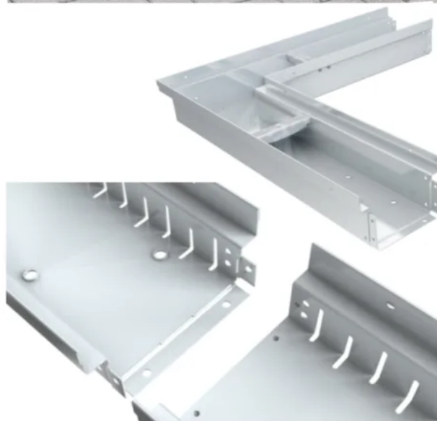
BIRCOtopline® mit praktischem Stecksystem und vorgefertigten 90° Winkelementen