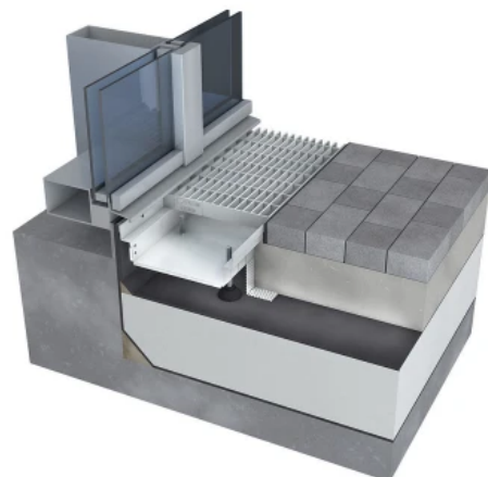
BIRCOTopline® – optional mit stufenlos einstellbaren Schraubfüßen

Weil BIRCOTopline® für Verarbeiter gestaltet wurde, ist eine Verlegung von oben mit einem Stecksystem möglich. Einfach, schnell und mit einem „Klack“ rasten die Bauteile sicher ein. Optionale Verschraubungsknebel ermöglichen eine sichere Befestigung der Abdeckung mit Schrauben. Damit wird sichergestellt, dass die Roste nicht verrutschen. Ein fester Sitz ist in Einsatzbereichen mit Rollstuhlübergängen oder Kitas wichtig. Die neue modulare Knebellösung ist auch für die 90° Eckelemente vorgesehen, welche für jede Bauhöhe zur Verfügung stehen. Mit den drei Bauhöhen 50, 75 und 100 mm lässt sich minimal oder maximal planen. Für besondere und höhere Einbauhöhen stehen die optionalen, stufenlos einstellbaren, Schraubfüße und eine passende Kieseiste zu Verfügung. Das aufstockbare Aufsatzelement bietet einen weiteren Baustein für den Terrassenbau (siehe BIRCOTopline® Punktentwässerung im weiteren Verlauf dieses Abschnitts).