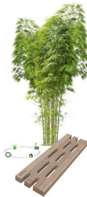
BIRCOtopline® Design-Abdeckung Bamboo