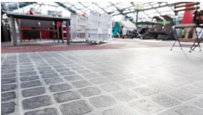
Der Auftrag sah die Verlegung von einem Vinyl-Designboden auf Verbundsteinpflaster im Edelsplitt vor, wobei das Verbundsteinpflaster auch noch für eine spätere Nutzung erhalten bleiben sollte.

Objektbericht zur Referenz Hagebaumarkt Paderborn