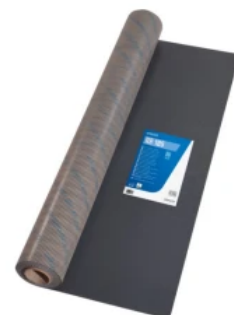
UZIN RR 185: Flexible, lose auszulegende, stabilisierende und dampfdichte Fiberglasunterlage