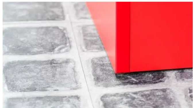
Mit dem Trockenklebstoff SIGAN ELEMENTS PLUS in Kombination mit der Stabilisierungsunterlage UZIN RR 185 konnte der neue Bodenbelag schnell und unkompliziert verlegt werden.