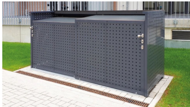
Mülltonnen-Boxen L, Quadratlochblech