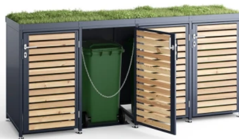
Mülltonnen-Boxen M, Holz, mit Gründach