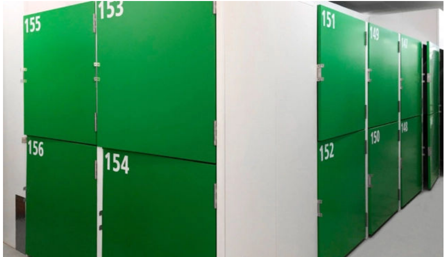
Lager-Boxen, Vollblech, Reingrün RAL 6037