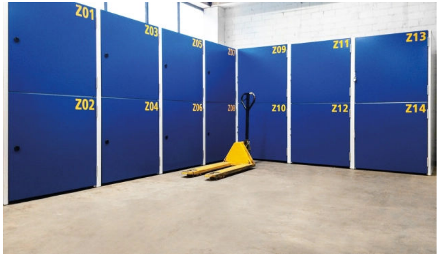
Lager-Boxen, Vollblech, Ultramarinblau RAL 5002