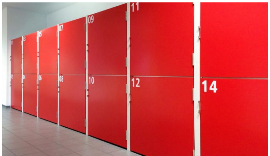
Lager-Boxen, Vollblech, Reinrot RAL 3028

Individuelle Nummerierungen dienen der Orientierung und Wiedererkennung des Firmen-Brandings. Glatte und schmutzabweisende Oberflächen sorgen langfristig für ein ansprechendes Erscheinungsbild.