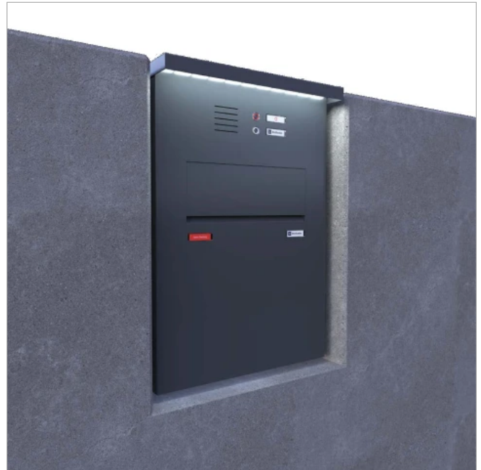
First Class Avantgarde Zaunbriefkasten

Einzelbriefkästen für Einfamilienhäuser mit vielfältigen Montagemöglichkeiten.