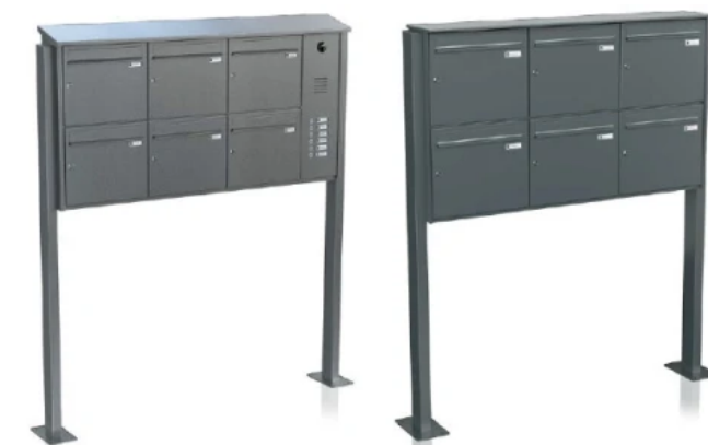
links: Business Class Standbriefkasten / freistehende Anlage rechts: Economy Class Standbriefkasten / freistehende Anlage