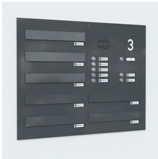
Business Class Mauerdurchwurfanlage: Alufontplatte mit Einwurfklappe pulverbeschichtet