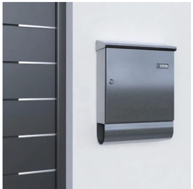
Edelstahl Einzelbriefkasten mit Zeitungsbox

Die aus hochwertigen Materialien gefertigten Briefkästen besitzen eine lange Lebensdauer und zuverlässige Funktion über Jahre.