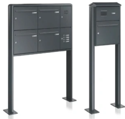
links: Business Class Standbriefkasten / freistehende Anlage rechts: Economy Class Standbriefkasten / freistehende Anlage