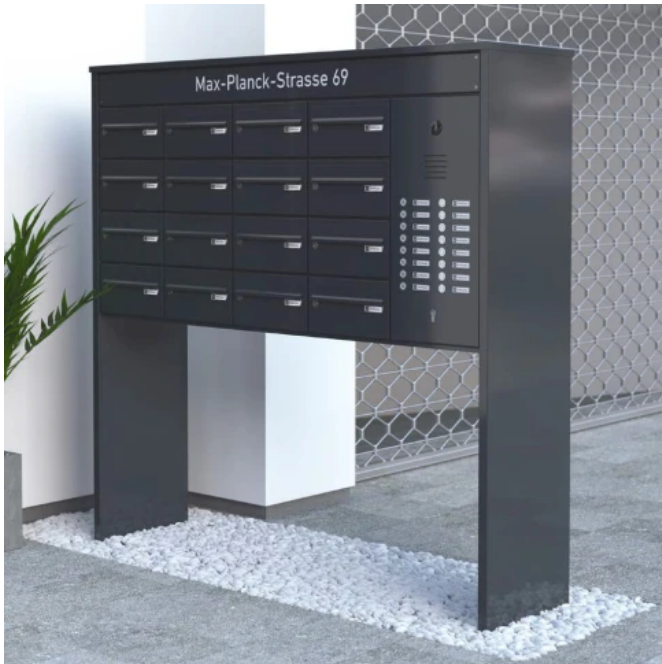
First Class Standbriefkasten / freistehende Anlage