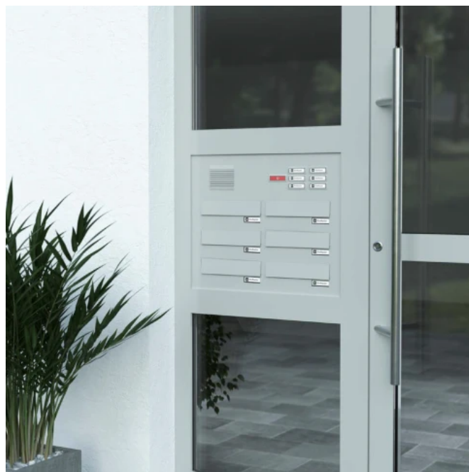
Economy Class Türseitenteilanlage