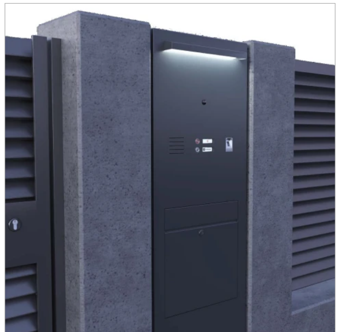
First Class Briefkastenstelen