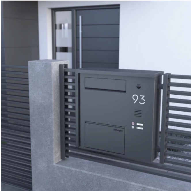
First Class Avantgarde Zaunbriefkasten mit Zeitungsfach

Aus der Serie Briefkastenanlagen von JU-Metallwarenfabrik