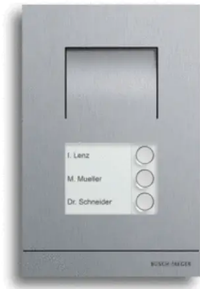
Busch-Welcome® Außenstation Audio

Aus der Serie Türkommunikationssysteme von Busch-Jaeger von Busch-Jaeger