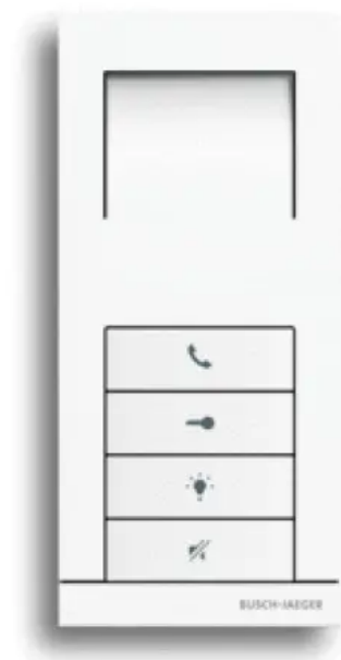
Busch-Welcome® Innenstation Audio