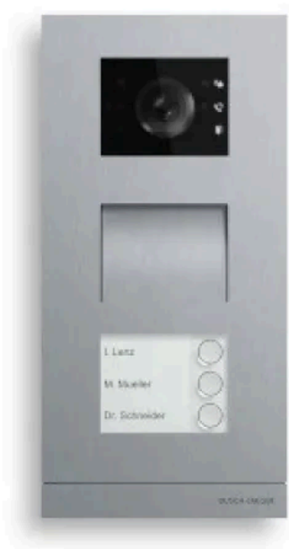
Busch-Welcome® Modulare Außenstation

Aus der Serie Türkommunikationssysteme von Busch-Jaeger von Busch-Jaeger