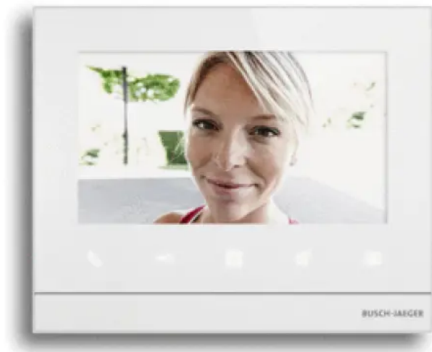
Busch-Welcome® Innenstation Video

Aus der Serie Türkommunikationssysteme von Busch-Jaeger von Busch-Jaeger