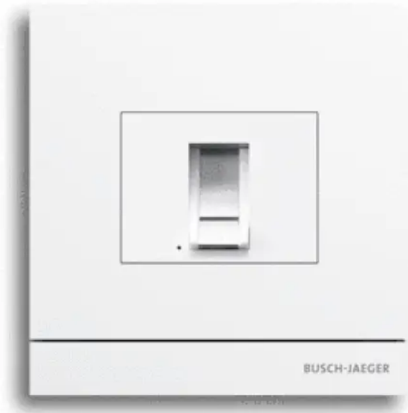
Fingerprintmodul für Zutrittskontrolle

Aus der Serie Türkommunikationssysteme von Busch-Jaeger von Busch-Jaeger