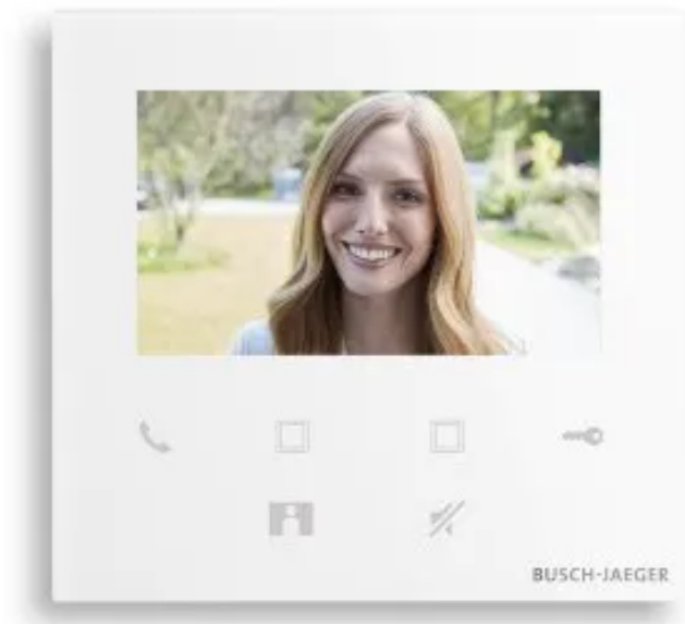
Busch-Welcome® Innenstation Video 4,3"