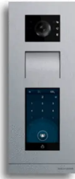
Busch-Welcome® IP Außenstation Video mit Touchdisplay