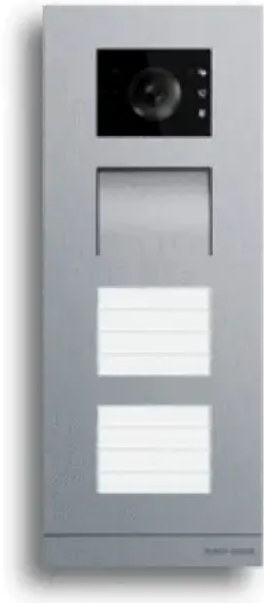
Busch-Welcome® IP Außenstation Video mit Namensschildtaster

Aus der Serie Türkommunikationssysteme von Busch-Jaeger von Busch-Jaeger