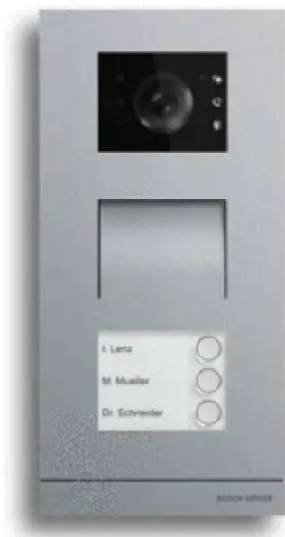
Busch-Welcome® Außenstation Video