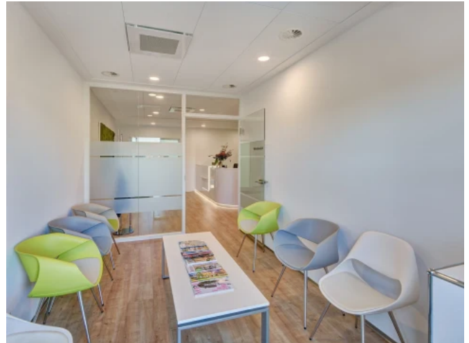
Ärztehaus 2.0, Marburg - Planung: integrale planung / Stefan Rover, Marburg | Foto: Caparol / Fotodesign Andreas Braun