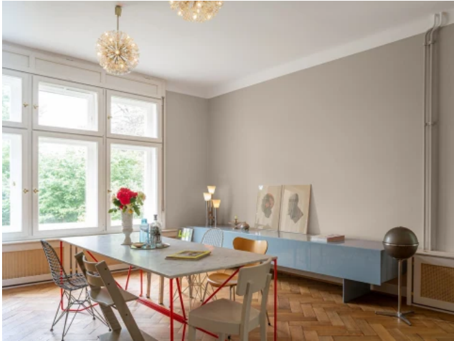
Gründerzeitvilla, Göttingen - Planung: Prof. Markus Schlegel, HAWK Hildesheim / Caparol

Aus der Serie Innenraumgestaltung von CAPAROL Farben Lacke Bautenschutz