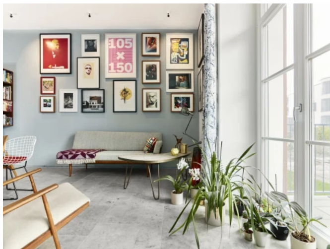
Privatwohnung, Ingolstadt - Planung: NO W HERE Architekten Designer