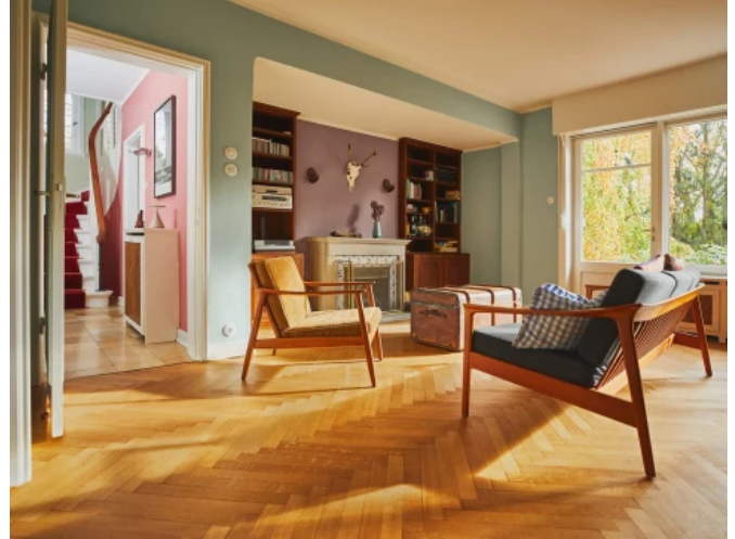
Einfamilienhaus, Hamburg - Planung: Caparol / Dipl.-Des. Martina Lehmann