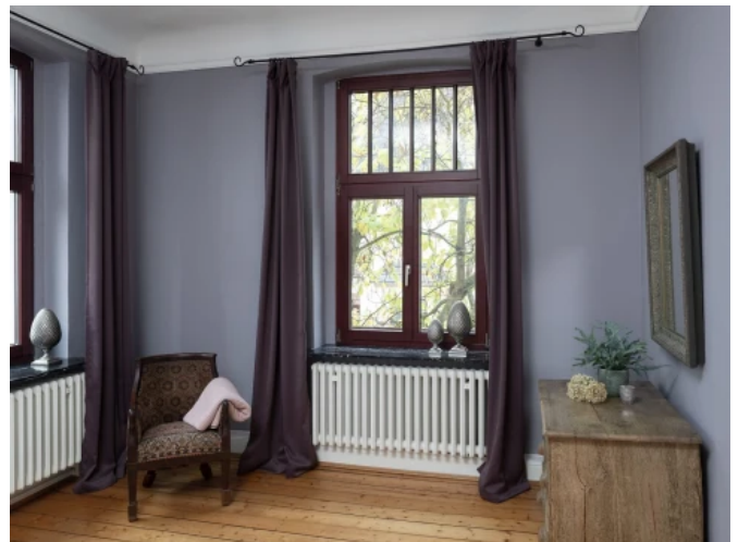
Jugendstilvilla, Essen - Planung: Caparol / Dipl.-Des. Margit Vollmert