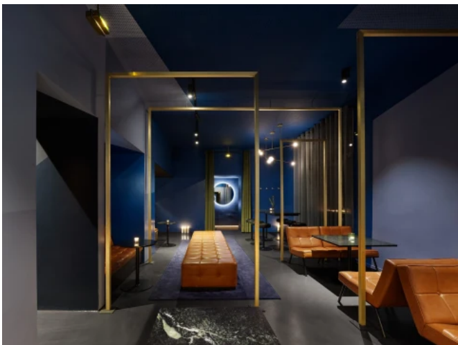
Barlounge Blau, Stuttgart - Planung: Somaa