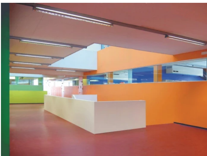
Haupt- und Polytechnische Schule, Schwanenstadt, Österreich - Planung: PAUAT Architekten, Österreich