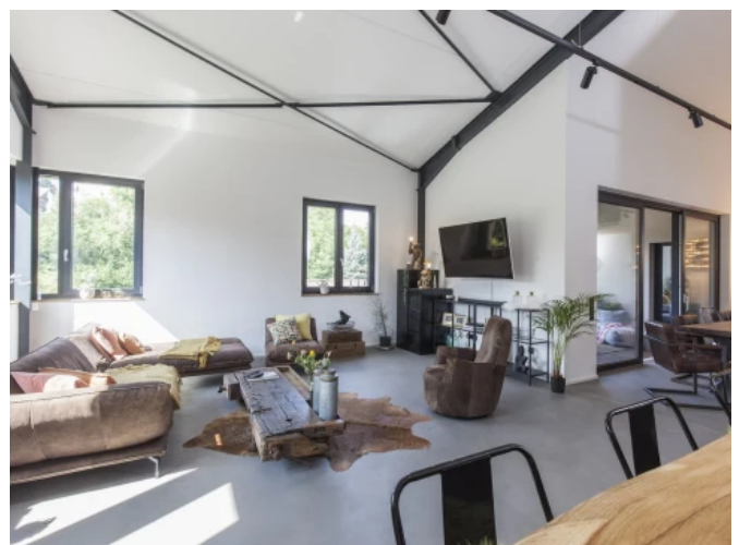
Loft entstanden aus Autowerkstatt - Planung: Arnold Lipp / Markus Kläger / Astrid-Sibylle Tober