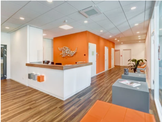
Ärztehaus 2.0, Marburg - Planung: integrale planung / Stefan Rover, Marburg

Aus der Serie Innenraumgestaltung von CAPAROL Farben Lacke Bautenschutz