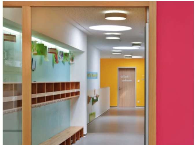
Kindergrupe St. Johannes, Pfaffenhofen a. d. Ilm - Planung: ArchiZell Projekt GmbH