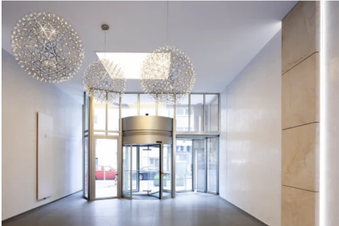
RÜ-Karree, Essen - Planung: Brockhoff und Partner Immobilien | Fotos: Caparol