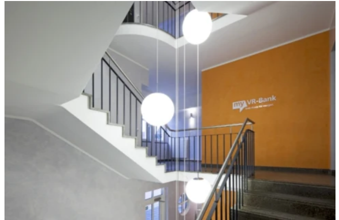
VR-Bank eG, Alzenau - Planung: Planungsbüro für Hochbau Detlef Wildgruber