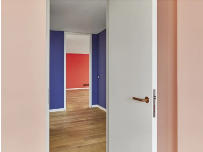
Palais Oppenheim , Köln - Planung: RENNER HAINKE WIRTH ZIRN ARCHITEKTEN GmbH / Simone Ferrari | Fotos: Jochen Stüber Fotografie

Aus der Serie Innenraumgestaltung von CAPAROL Farben Lacke Bautenschutz