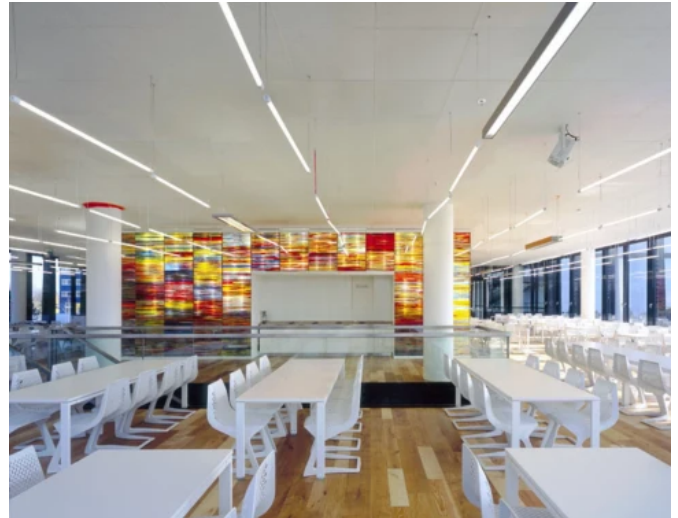
Lichtbox, Süddeutscher Verlag, München - Planung: GKK+Architekten Prof. Swantje Kühn / Oliver Kühn