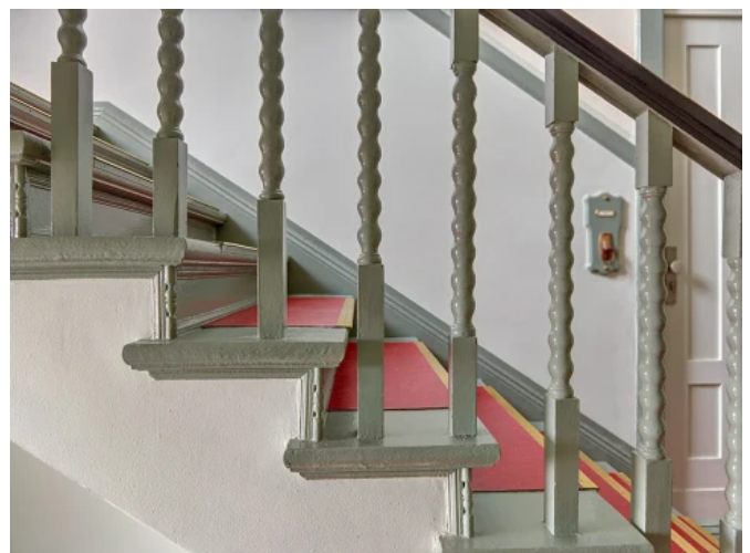
Wohngebäude, Berlin Spandau - Architekt: | Fotos: ?