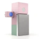
Capatect Faserbeton Sockelelement

Weitere Informationen zu Capatect-Faserbeton