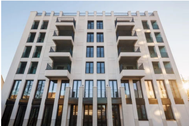
Neubau Mehrfamilienhaus, Frankfurt/Main - Planung: Wentz Planungsgesellschaft mbH & Co. KG

Aus der Serie Fassadengestaltung und Fassadendämmung von CAPAROL Farben Lacke Bautenschutz