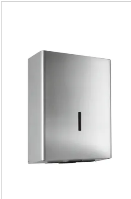
Der Papierhandtuchspender fasst 750 Faltblätter und vermeidet durch die abgerundete Haubenform ein mögliches Verletzungsrisiko.