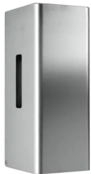
Der Toilettenpapierspender für 2 Rollen stellt sicher, dass immer ausreichend Papier zur Verfügung steht.