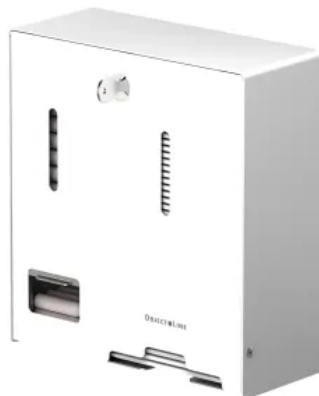
CWS ObjectLine Kombispender für Tampons und Hygienebinden Variante Edelstahl, weiß pulverbeschichtet, RAL 9003