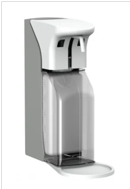
Der Universalspender Non-Touch 500 und 1000 ist speziell für den Klinik- und Praxisbedarf konzipiert.

Aus der Serie CWS ObjectLine Waschraumausstattungen von CWS Hygiene Deutschland