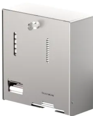
CWS ObjectLine Kombispender für Tampons und Hygienebinden Variante Edelstahl, matt gebürstet

Die neuen Kombispender für Tampons und Hygienebinden lesiten besonders in öffentlichen oder halböffentlichen Bereichen, wie am Flughafen, in der Schule oder Uni, im Restaurant oder auch am Arbeitsplatz einen wichtigen Beitrag zu Wohlfühlhygiene und Infektionsschutz.