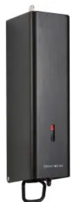
Seifenspender ObjectLine, schwarz RAL 9005