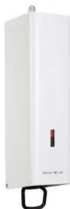
Seifenspender ObjectLine, weiß RAL 9003