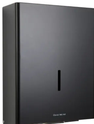
Papierspender ObjectLine 750, schwarz RAL 9005