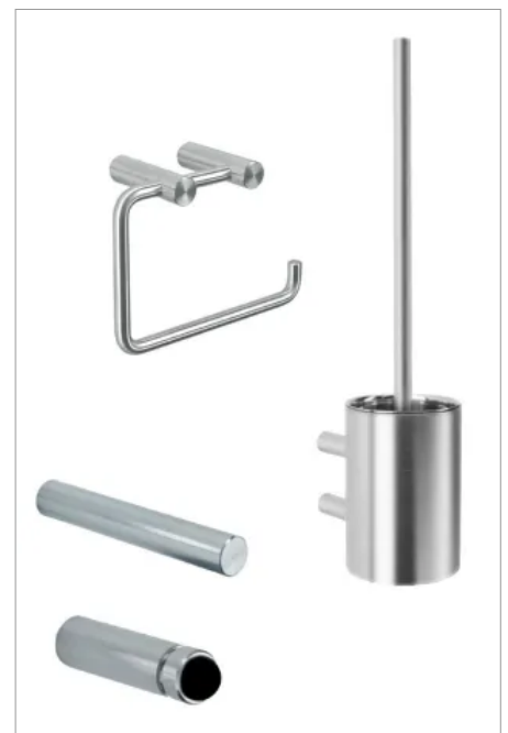
Zu den Spendern werden passende Ergänzungsprodukte angeboten: Toilettenpapierhalter, Reserverollenhalter, Türpuffer/Haken und Bürstengarnituren.