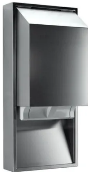
Die Stoffhandtuchspender nehmen für 21 cm breite Stoffhandtuchrollen auf. Bei den Bedienungsvarianten kann zwischen mechanischer und Non-Touch Version gewählt werden.