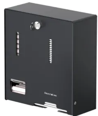
CWS ObjectLine Kombispender für Tampons und Hygienebinden Variante Edelstahl, schwarz pulverbeschichtet, RAL 9005