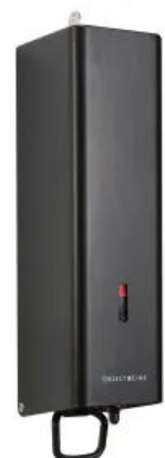
Seifenspender ObjectLine, schwarz RAL 9005