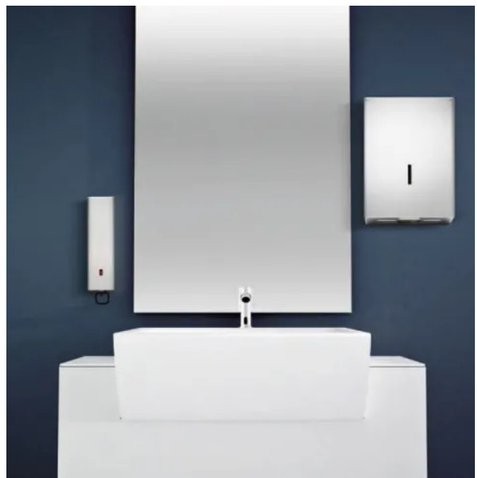
CWS Edelstahl-Ausstattungen ObjectLine