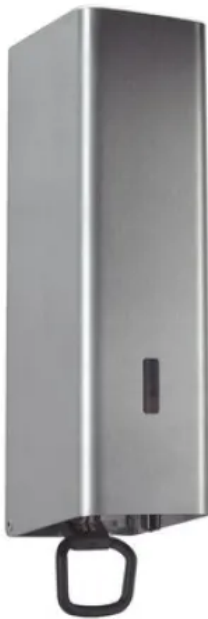
Die Spender für Seifencreme bzw. Seifenschaum, wahlweise mit 0,5 oder 1 Liter Inhalt lassen sich mit einer Hand bedienen.

Aus der Serie CWS ObjectLine Waschraumausstattungen von CWS Hygiene Deutschland