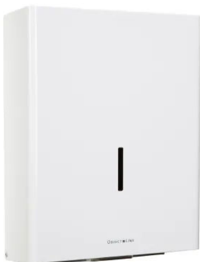
Papierspender ObjectLine 750, weiß RAL 9003