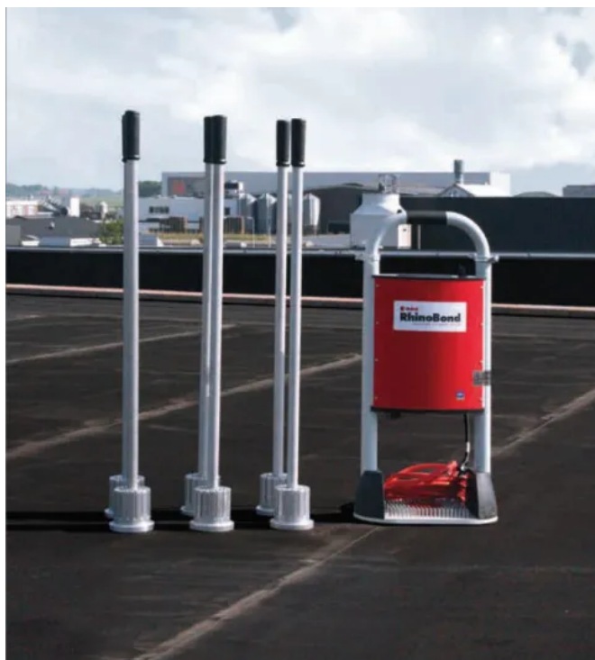
HERTALAN® RhinoBond Befestigungssystem