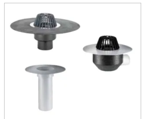
Dachabläufe 62 DallBit, 64 PVC und Aufstockelement 630 PVC

Für Flachdächer aus Beton bieten die Brandschutz-Rohbauelemente 1 und 5 in Kombination mit dem Dachablauf 62 geprüften Brandschutz in den Klassen R 30/60/90/120.