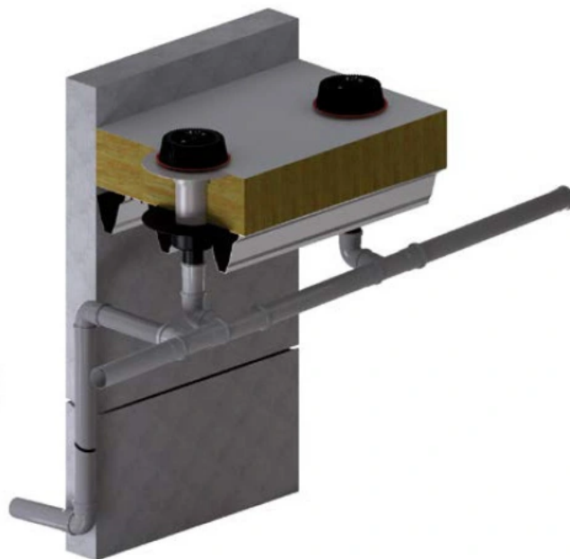
Dallmer Notentwässerung für Flachdach über die Falleitung