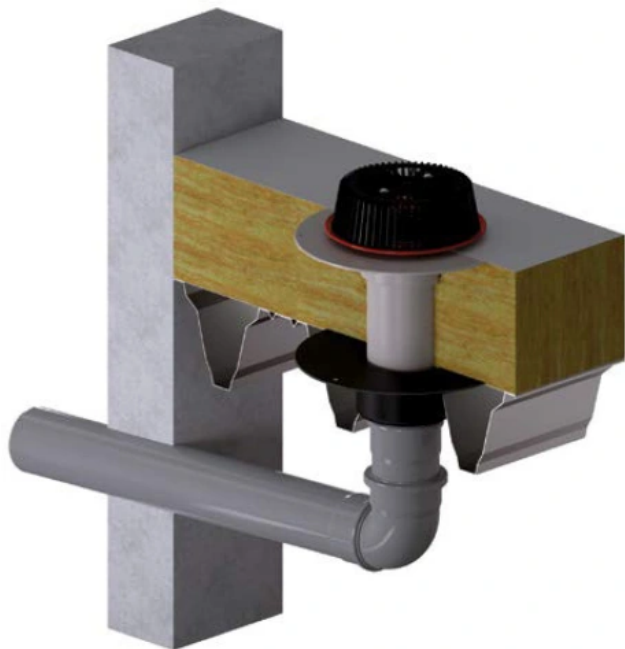
Dallmer Notentwässerung für Flachdach, frei auslaufend

Aus der Serie Entwässerungssysteme für den Außenbereich von Dallmer