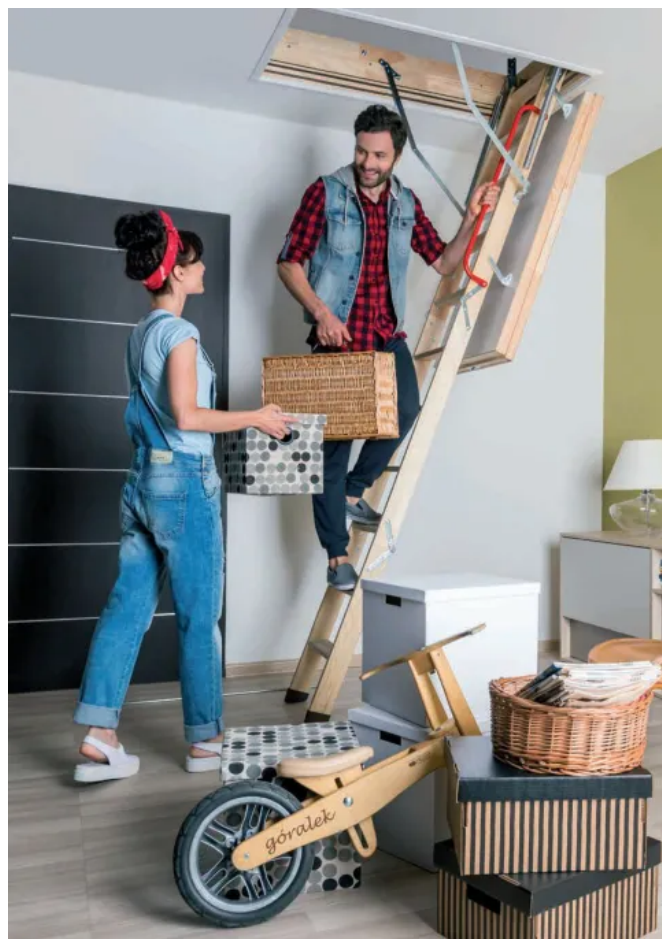
FAKRO Bodentreppe mit mehrteiliger Holzleiter