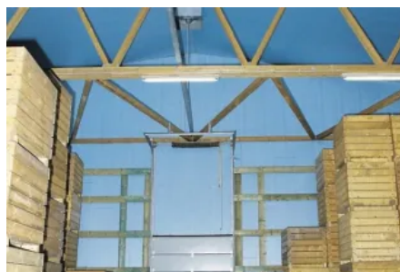
Landwirtschaft Stalldämmung – Lagerung von Kartoffeln