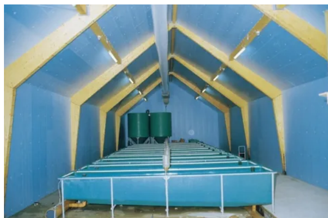
Dämmung eines Beckens für Fischzucht