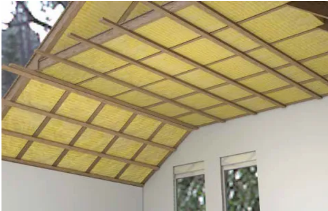
Dachschrägenbekleidungen können mit Unterkonstruktionen aus Holzlattung oder Metallprofilen (CD- oder Hut-Deckenprofile) ausgeführt werden.

Aus der Serie Danogips - Gipsplattensysteme von Danogips