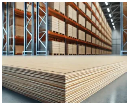
Delignit® Industrieböden für die Lagertechnik