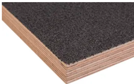
Delignit® Industrieböden Eco anthrazit mit Filmbeschichtungen