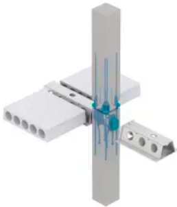
Auflagerung mit der PCs Konsole

Der DELTABEAM® Verbundträger kann als Einfeld- oder Durchlaufträger ausgeführt werden. Individuelle projektbezogene Querschnitte sind ebenfalls möglich. Die prüffähige Bemessung erfolgt durch den Technischen Support von Peikko.