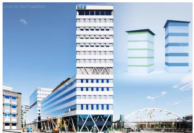
Slim-Floor-Konstruktion für flexible Grundrisse und Reduzierung der Kubikmeter

Realisierung einer zusätzlichen Etage in Gebäuden: Die Wahl des Deckensystems als Slim-Floor-Konstruktion für ein neues Projekt bedeutet flexible Grundrisse und mehr Stockwerke bei gleicher Gebäudehöhe. Beim Bau von Untergeschossen wird zudem die Aushubtiefe minimiert. Durch die Reduzierung der Kubikmeter pro Quadratmeter fallen geringere Energiekosten an und das Gebäude ist nachhaltiger.