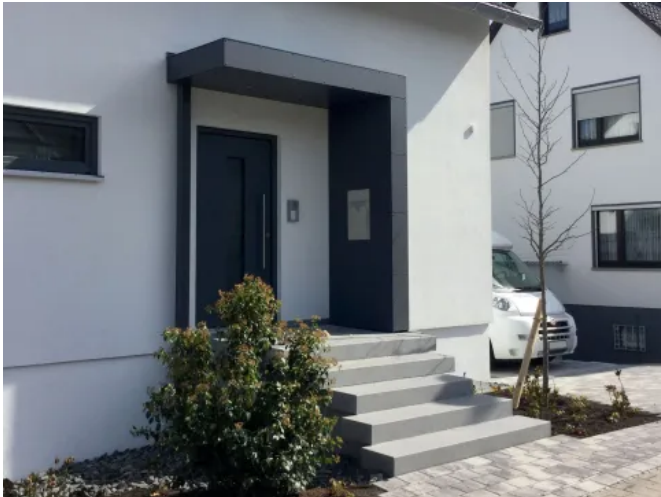
S.1-Eingangüberdachung L-Form mit Stütze

Aus der Serie Überdachungen von Siebau Raumsysteme