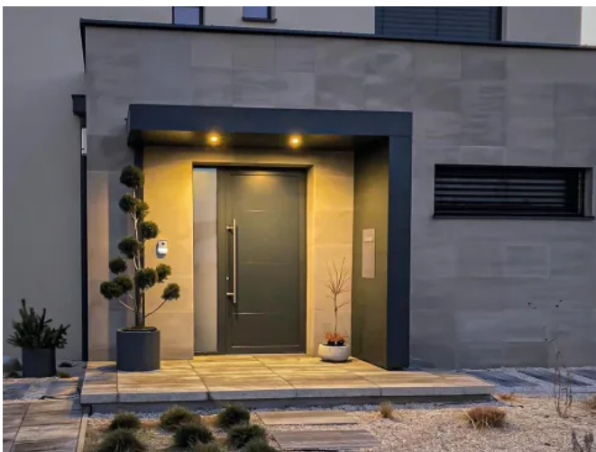
S.1-Eingangüberdachung mit Stütze an der offenen Seite