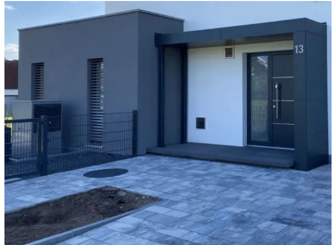
S.1-Eingangüberdachung L-Form mit zwei Stützen