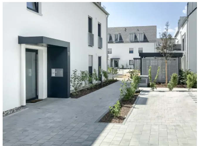
S.1-Eingangüberdachung L-Form mit Briefkasten