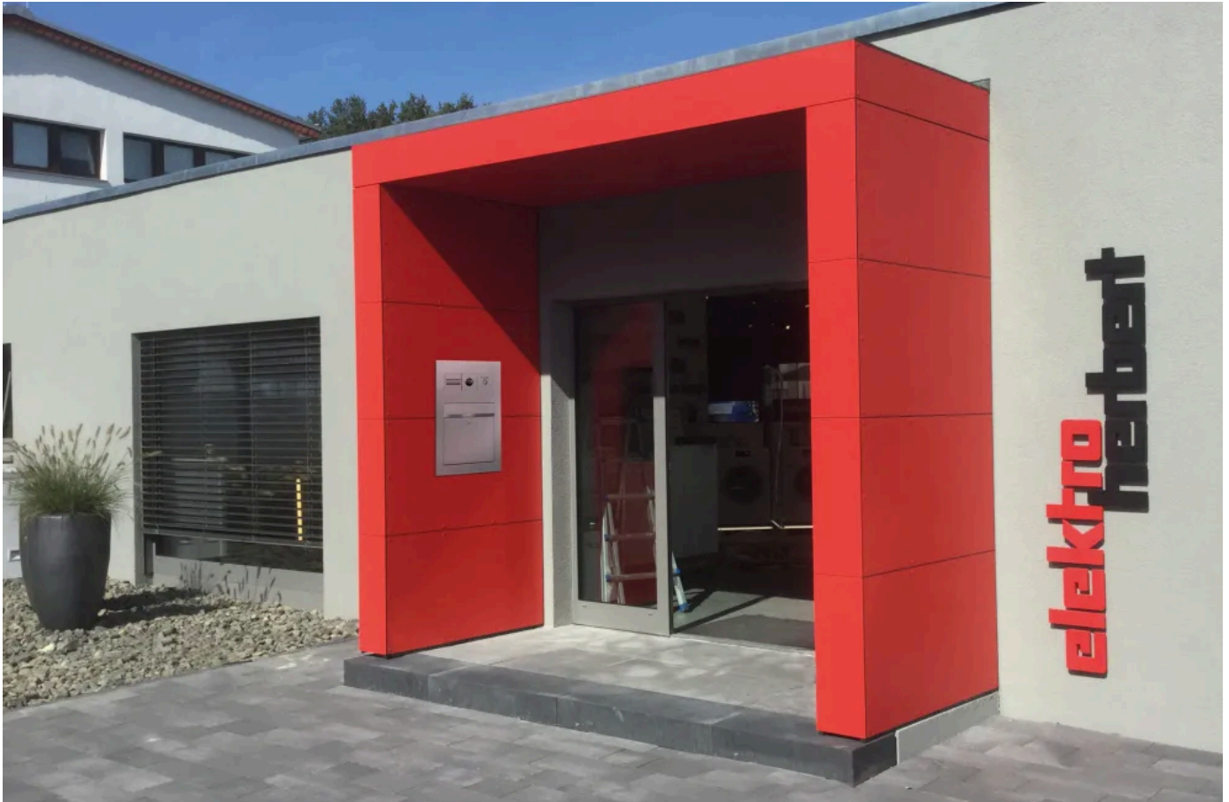
Vordach S.1 in U-Form mit roten Fassadenplatten

Aus der Serie Überdachungen von Siebau Raumsysteme