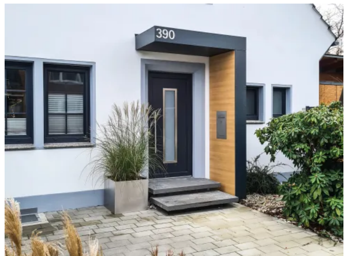
S.1-Eingangüberdachung mit Fassadenplatte in Holzdekor