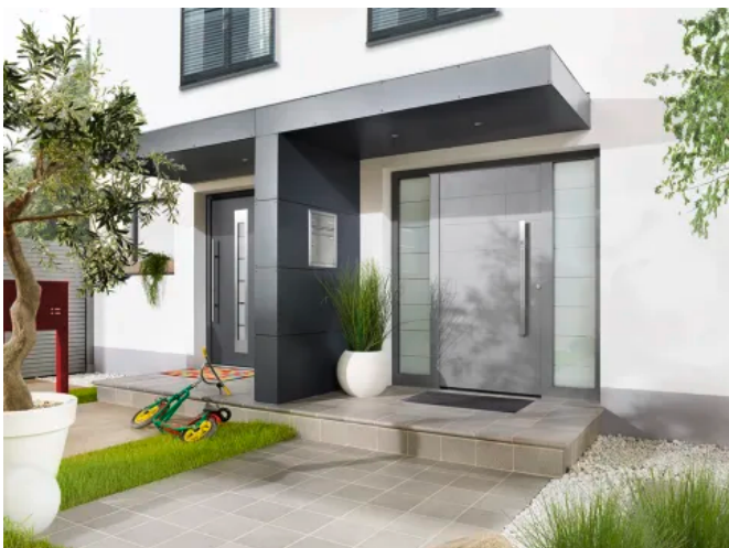
S.1-Eingangüberdachung T-Form mit Briefkasten