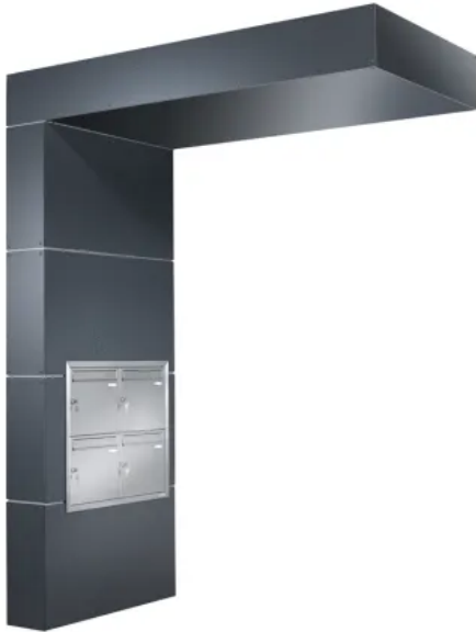
Eingangsüberdachung L-Form mit Briefkastenanlage

Aus der Serie Überdachungen von Siebau Raumsysteme