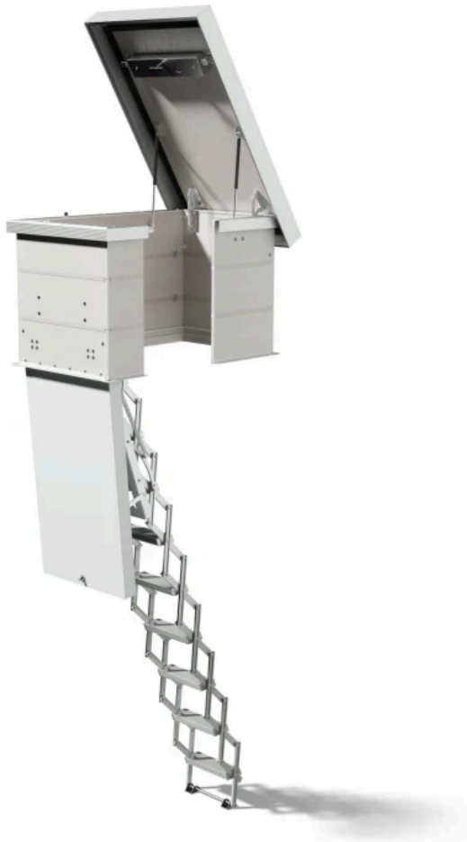
Flachdachausstieg mit clickFIX® vario