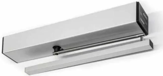
Gilgen Drehflügelantrieb FD 20-F Brandschutz

Bei Brandalarm schließt die Tür aus jeder Position – anschließend kann der Rauch- und Feuerabschluss manuell geöffnet werden und als Fluchtweg dienen.