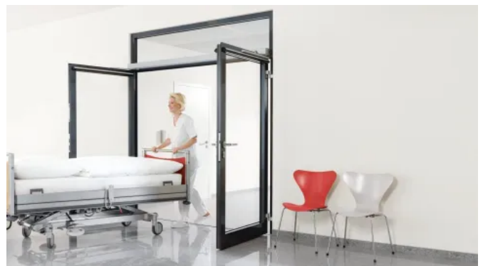
Drehflügel Türantrieb ED 100/ED 250 zweiflügelig