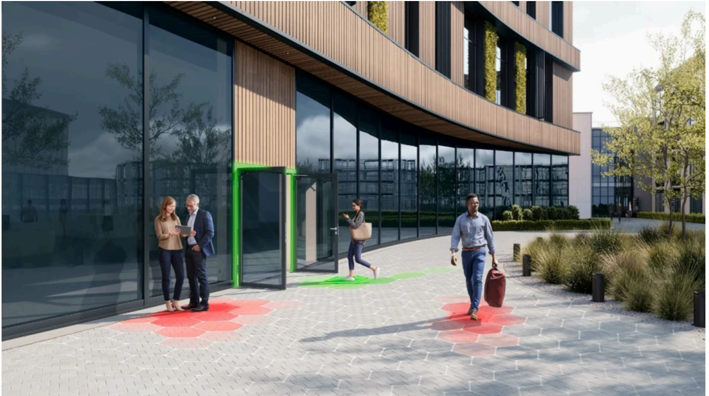
Das intelligente Türsystem MotionIQ

MotionIQ optimiert die Steuerung von automatischen Drehflügeltüren mit ED 100 , ED 250 und kann für neue als auch für bestehende Systeme verwendet werden.