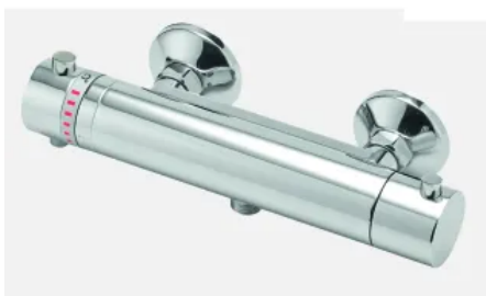
Brausethermostat - Manuell