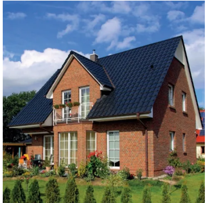
Zweischaliges Mauerwerk mit Klinkerfassade kann nachträglich mit Dämmstoff-Granulat saniert werden.

HIRSCH PoroBead 033 wird aus einem innovativen Rohstoff auf EPS-Basis hergestellt, ist wasserabweisend und vollständig recycelbar. Für die schnelle und wirtschaftliche Verarbeitung von HIRSCH PoroBead 033 sorgt das spezielle HIRSCH Porozell Einblasverfahren. So können selbst schwer zugängliche Bereiche sicher und gleichmäßig mit dem Granulat aufgefüllt werden. Die nachträgliche Kernndämmung mit HIRSCH PoroBead 033 senkt die Wärmeverluste bei Bestandsgebäuden und verbessert die Behaglichkeit. Mit HIRSCH PoroBead 033 gedämmte Außenwände sparen Heizenergie und tragen durch Verringerung des CO 2 -Ausstosses zur Umweltentlastung bei.