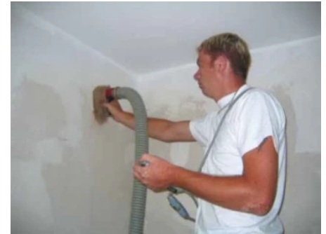
Schwer zugängliche Stellen können auch durch kleine Öffnungen von innen erreicht werden.