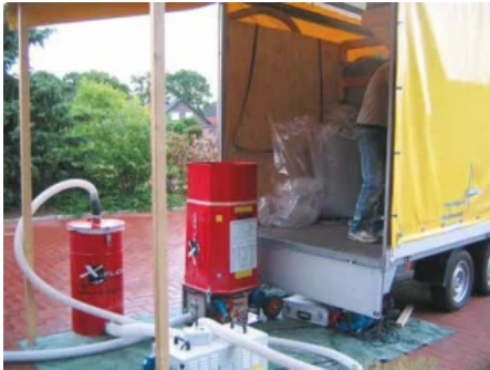
Geschulte und zertifizierte Fachbetriebe sorgen für eine schnelle und staubfreie Einbringung.

Aus der Serie Wärmedämm Lösungen für die Gebäudesanierung von HIRSCH Porzell