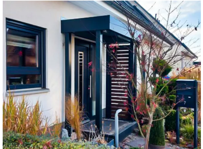
Vordach CP mit Sichtschutz