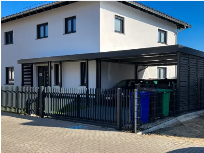
Vordach CP Carport mit Gerätehaus

Aus der Serie Überdachungen von Siebau Raumsysteme