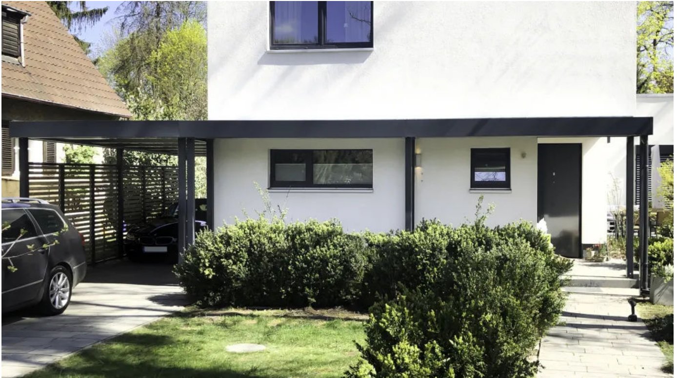
Vordach CP als Anbau an einen Carport

Aus der Serie Überdachungen von Siebau Raumsysteme