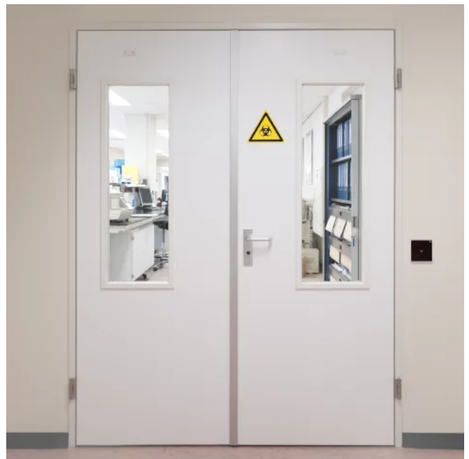
blueEvo erfüllt hohe Sicherheitsstandards in kritischen Infrastrukturen wie Krankenhäusern.