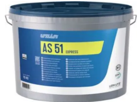
UZIN AS 51 EXPRESS zur Minderung des Wasserbedarfs von konventionellen Calciumsulfat- und Zementestrichen und Verkürzung der Wartezeit bis zur Belegreife