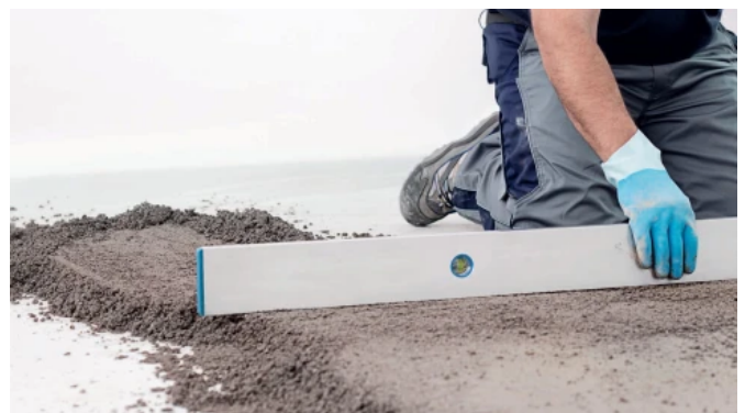
Die Belegreifgrenzwerte von Estrichen mit UZIN Estrichzusatzmitteln entsprechen den anerkannten Regeln bzw. dem Stand der Technik.