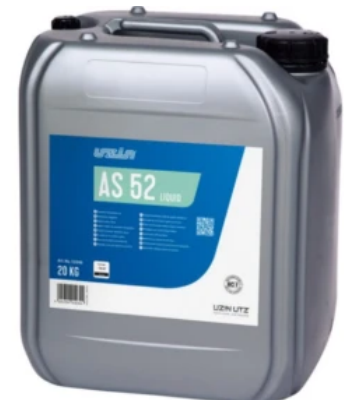
UZIN AS 52 LIQUID zur Minderung des Wasserbedarfs von Zementestrichen und Verkürzung der Wartezeit bis zur Belegreife