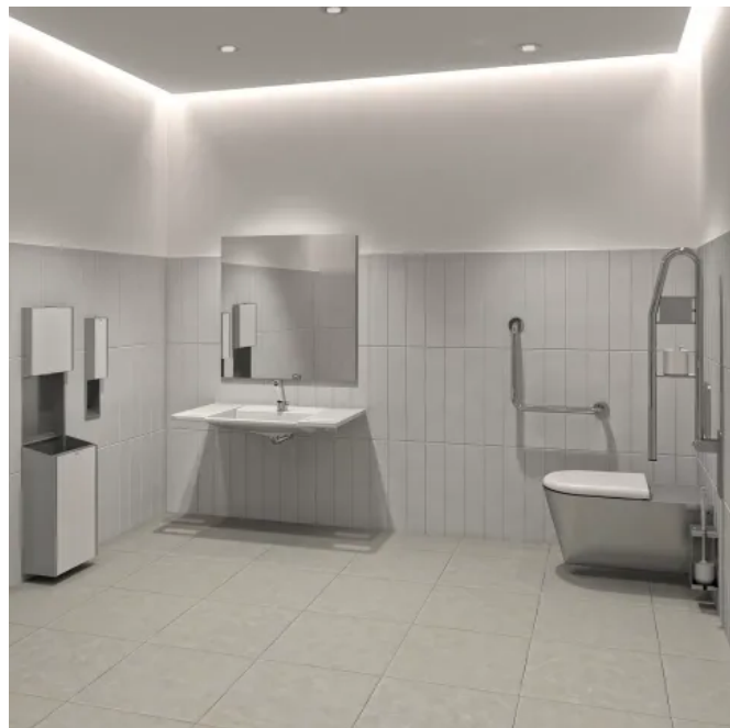
Barrierefreie Waschtischlösungen ergänzen die EXOS. Systemlinie