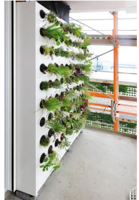
Vorgehängte, hinterlüftete Pflanzkassetten wurden mithilfe von Trägerschienen an der Fassade befestigt.