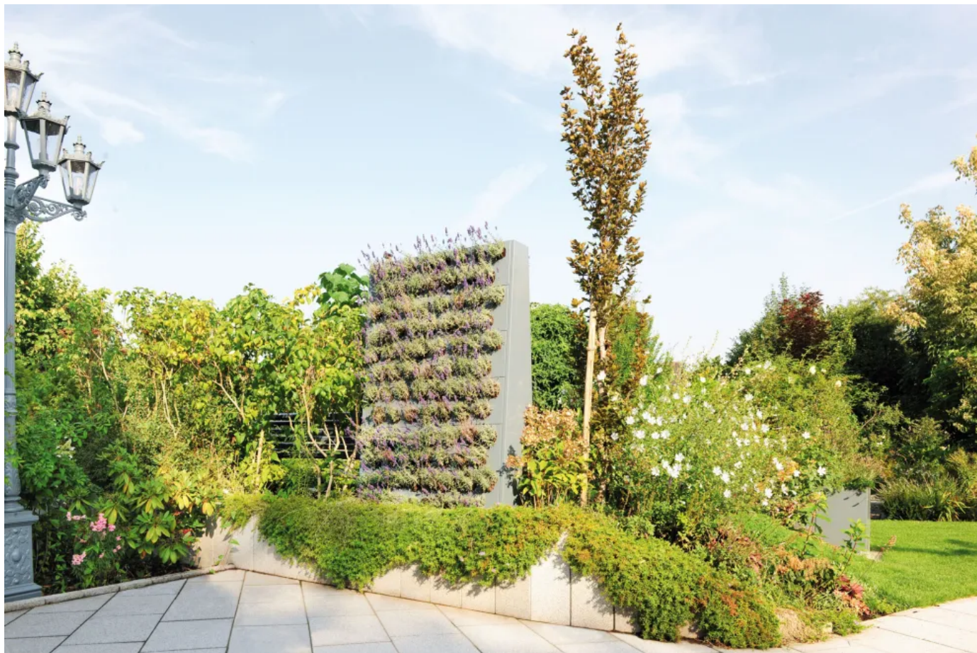
Beidseitige Bepflanzung möglich

Weitere Informationen im Technischen Datenblatt Pflanzwand Adam