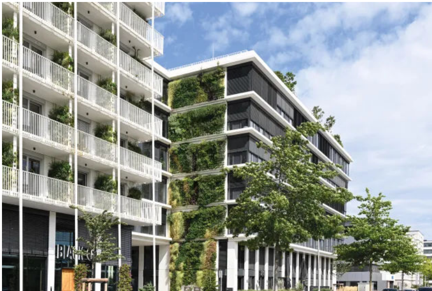
Diese Fassadenbegrünung stellt eine der größten vertikalen Vegetationsflächen in Deutschland dar.

Aus der Serie Nachhaltige Lösungen für Dach und Fassade von Richard Brink