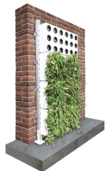
Unterkonstruktion mit Aufständerung