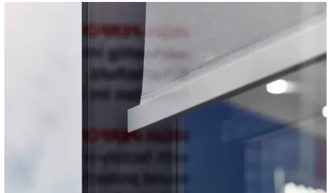
Neben den Raffstores ist ISOshade® auch mit einer integrierten Senkrechtmarkise erhältlich.