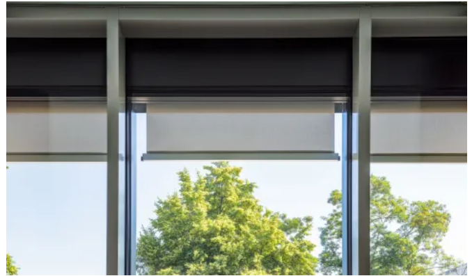
Die Fassadenelemente wurden mit einer integrierten Senkrechtmarkise ausgeführt.