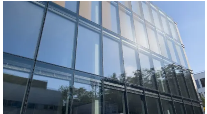
Bei einem Bürogebäude in München sorgt ISOshade® für maximale Transparenz.

Für ISOshade® verarbeitet seele hochwertige Materialien, um eine lange Lebensdauer der Fassadenelemente zu gewährleisten. Die Position im Scheibenzwischenraum schützt die Sonnenschutzanlage vor Witterung und Verschmutzung. Zudem ermöglicht die Revisionsklappe eine unkomplizierte Wartung des Fassadenelements, wodurch der Lebenszyklus weiter verlängert wird.