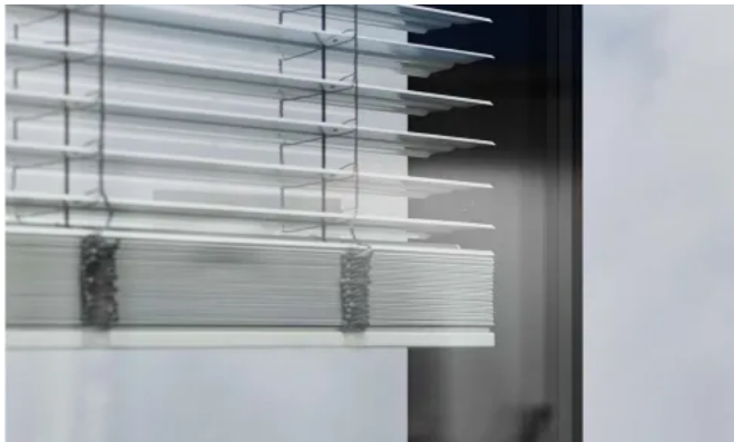
Raffstores mit Lichtenklammern sorgen für optimalen Lichteintrag.