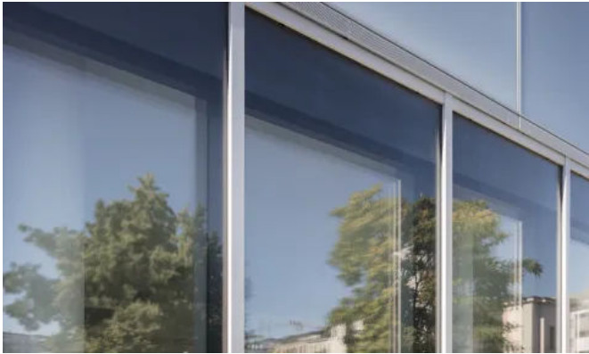
Die Sonnenschutzanlage befindet sich geschützt im Scheibenzwischenraum.

Aus der Serie ISOshade® – Fassadensystem von seele