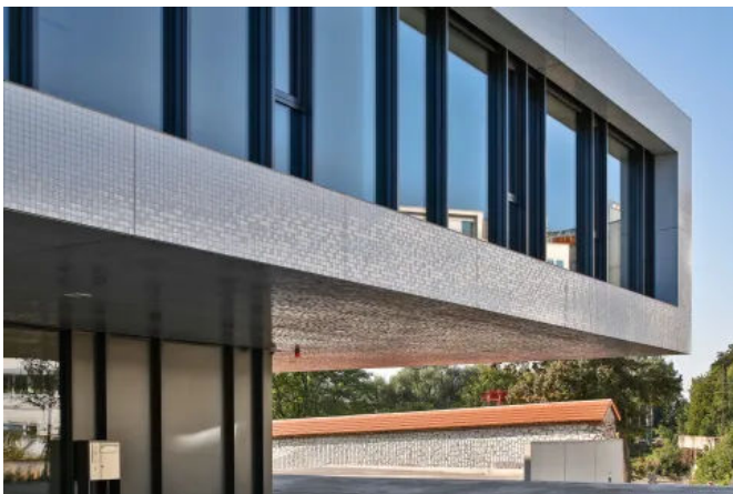
Hochschule für Kommunikation, Ulm, DE