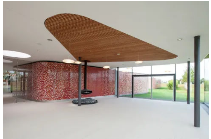
Familien- und Freizeitbad, Fellbach, DE