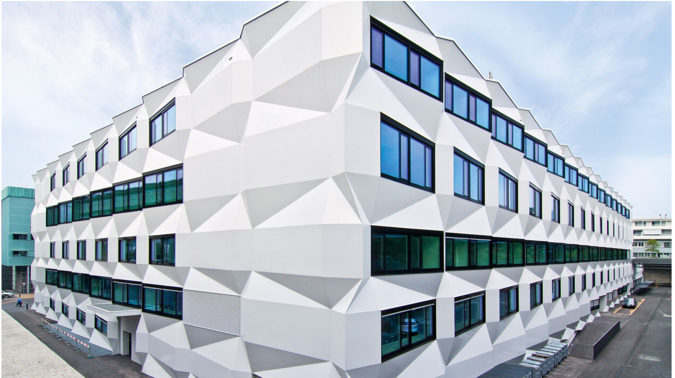
StoVentec R – Maximale Gestaltungsfreiheit für hinterlüftete Fassaden mit Putzoberfläche

Aus der Serie Vorgehängte hinterlüftete Fassadensysteme von Sto