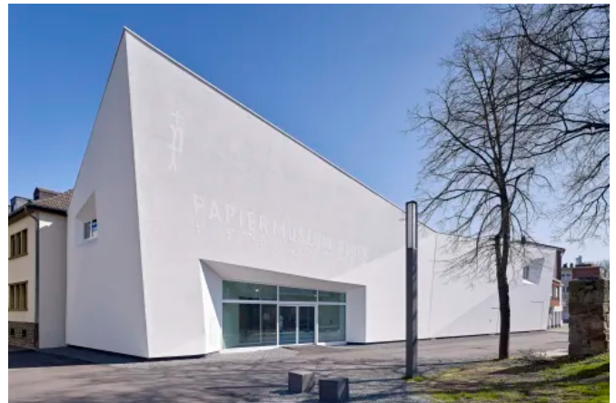
Papiermuseum Düren, DE