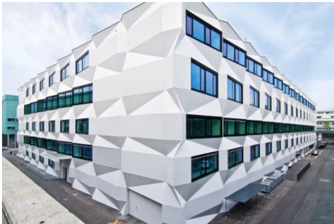
Uni PHZ, Luzern, CH