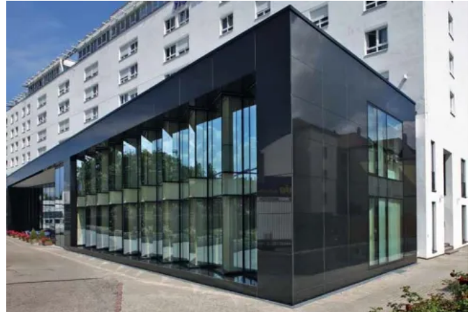
Hotel Stadt Freiburg, DE