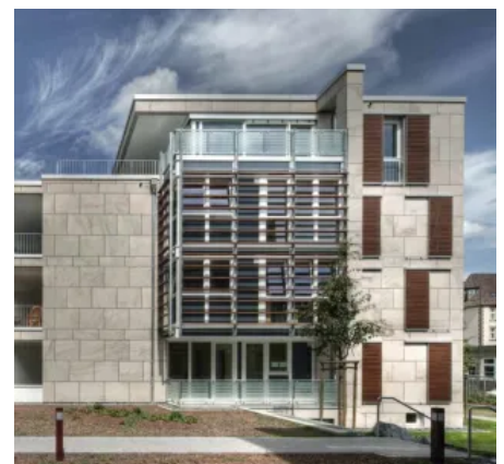
Stadtvillen "Wohnen am Botanischen Garten", Braunschweig, DE; Bauherr: Wiederaufbau Immobilien GmbH, Braunschweig, DE; Kanada Bau GmbH & Co., Beteiligungs- und Immobilien KG, Braunschweig, DE; Planung: Wolfgang Koch, Braunschweig, DE; Sto-Kompetenzen: StoVentec Stone Massive