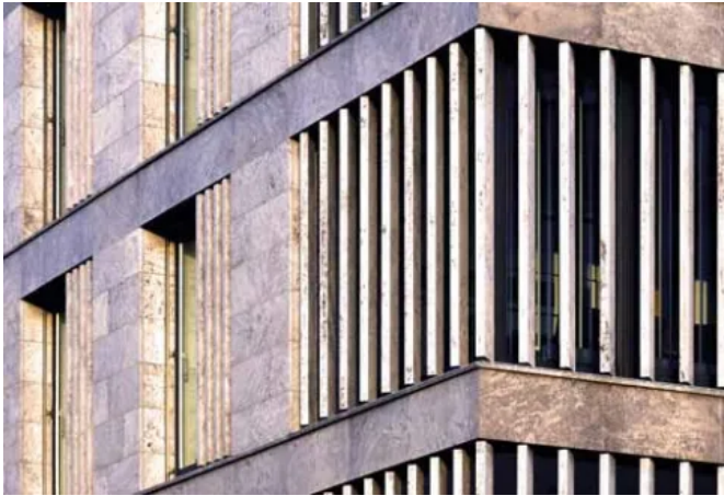
Sparkasse Mainfranken, Würzburg, DE