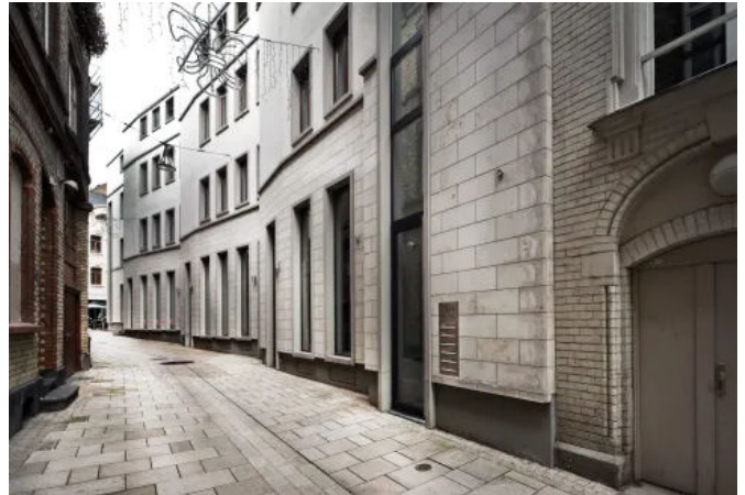
Wohn- und Geschäftshaus, Wiesbaden, DE