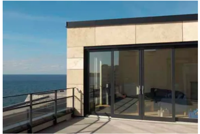
Ankarspelet, Malmö, SE