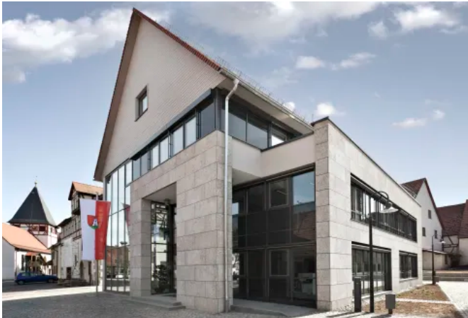
Rathaus Mönsheim, DE

Aus der Serie Vorgehängte hinterlüftete Fassadensysteme von Sto