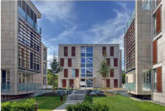
Wohnen am Botanischen Garten, Braunschweig, DE