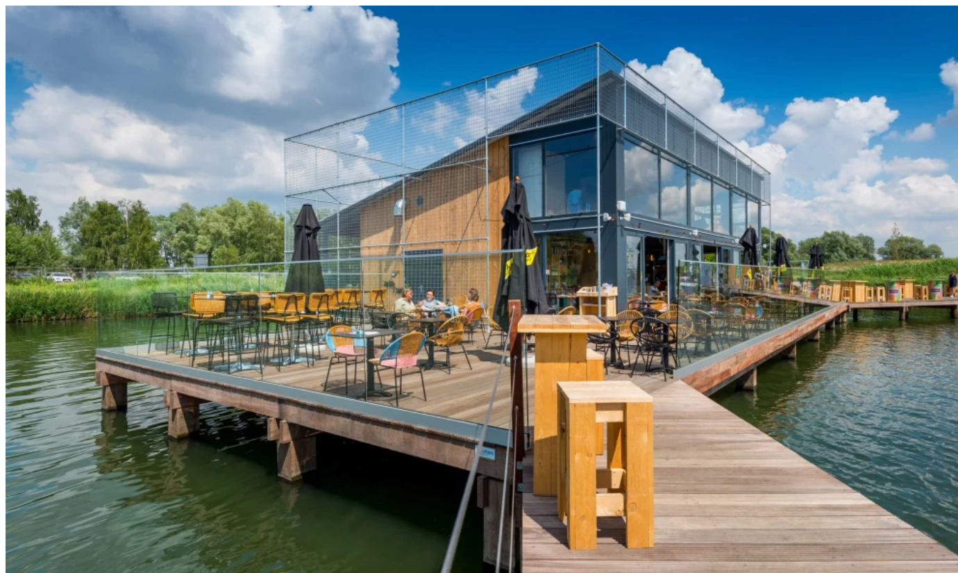
Wakeboardzentrum Antwerpen, Architekt: Inarco Architects bv | Foto: Ton de Bruin Fotografie

Weitere Informationen zu GEALAN-KONTUR ®