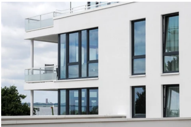
Südkap Pelzerhaken, WRS ARCHITEKTEN & STADTPLANER GmbH