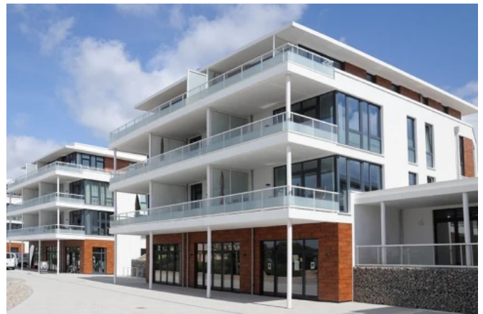
Südkap Pelzerhaken, WRS ARCHITEKTEN & STADTPLANER GmbH | Foto: Jens Seemann