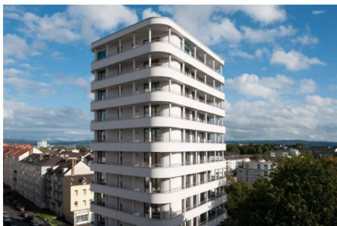
WestendTurm, Kassel