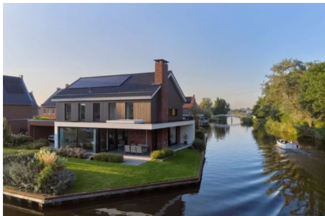
Wohnhaus Sneek, Niederlande, Architekt: Heeren 3 Architekten bna

Aus der Serie Fenster-Profilssysteme von GEALAN Fenster-Systeme