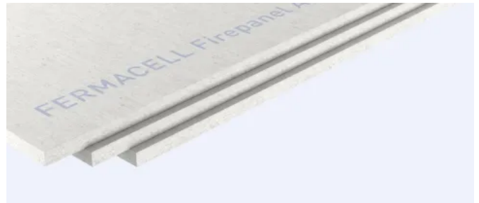
fermacell® Firepanel A1