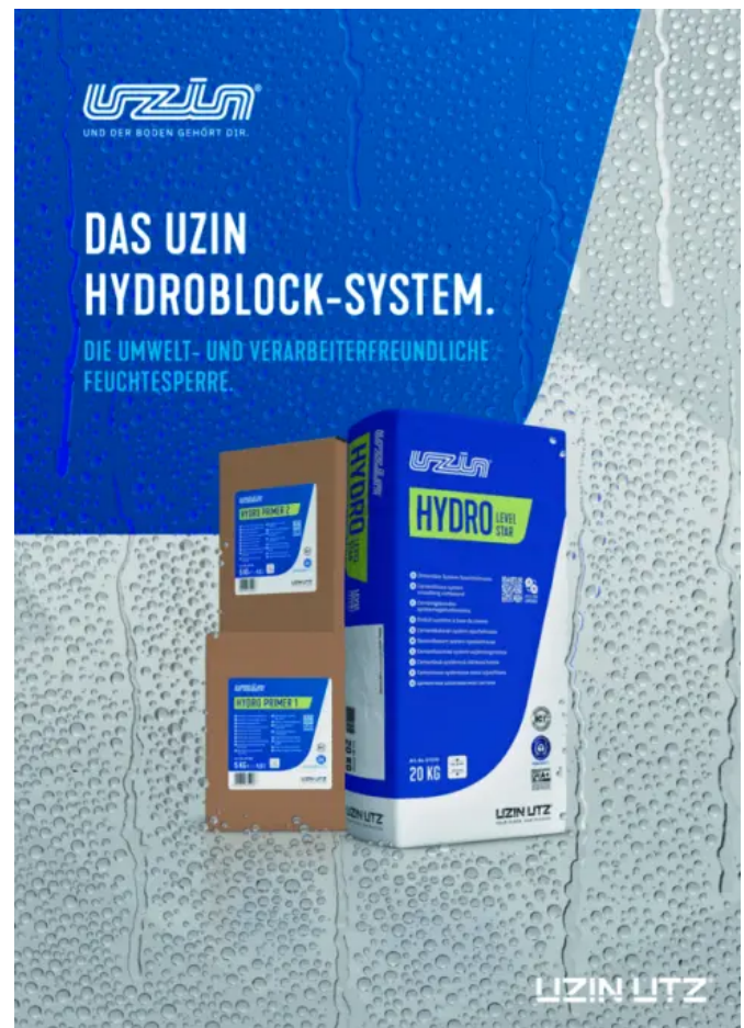
Feuchtesperresystem UZIN HYDROBLOCK – Die erste Feuchtesperre, die CO 2 einspart