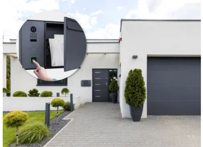
Der smarte ekey Briefkasten

Ausgestattet mit einer Ultraweitwinkel-HDTV-Kamera und einer 180°-Linse liefert das System gestochen scharfe Bilder. Selbst bei Dunkelheit sorgen zwölf Infrarot-LEDs für hervorragende Sicht, während fortschrittliche Sprachübertragung eine klare Kommunikation gewährleistet.