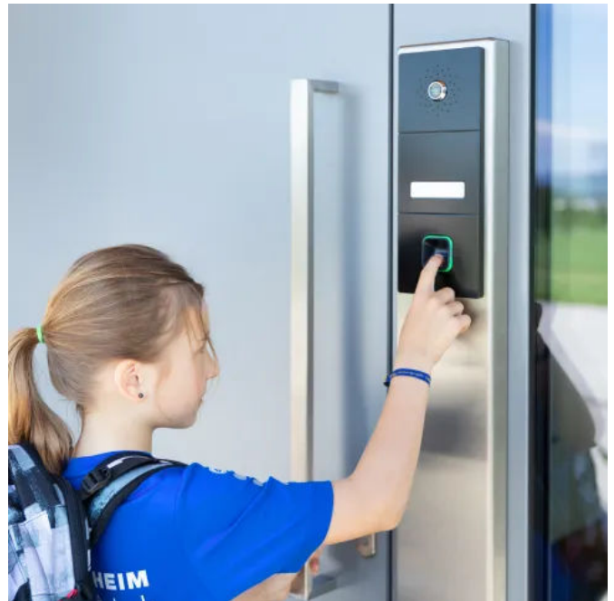
Eltern können sich auf Wunsch benachrichtigen lassen, wenn der Nachwuchs sicher nach Hause gekommen ist.

Die klassischen Vorteile des Fingerprints – wie schlüsselloses Öffnen, höchste Sicherheit oder mehr Komfort – werden bei ekey xLine und ekey sLine ergänzt von zusätzlichen Funktionen. Neben Basisfunktionen wie z. B. einem Zutrittsprotokoll, runden smarte Features den Funktionsumfang ab. So lassen sich etwa Zutrittspunkte mittels Fernöffnung auch unterwegs jederzeit bei Bedarf öffnen oder die Anbindung an den Sprachassistenten Amazon Alexa bringt zusätzlichen Komfort. Eine smarte Funktion, die besonders für Eltern praktisch ist: die Push-Nachricht. Damit kann man sich, wenn das Kind sicher von der Schule nach Hause gekommen ist und die Tür mit dem Fingerprint öffnet, auf Wunsch direkt informieren lassen. Auch Benutzer können von standardmäßig 20 auf bis zu 100 erweitert werden. Somit passen sich die Systeme genau an individuelle Bedürfnisse an.