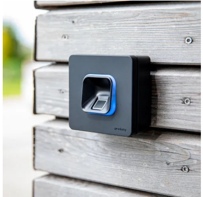
Den ekey xLine Fingerprint gibt es sowohl als Unter- als auch (wie hier abgebildet) als Aufputzvariante.

Die Inbetriebnahme an sich empfiehlt ekey durch den Endkunden selbst, da diese am Smartphone des Administrators, also dem Besitzer, erfolgen muss. Die ekey bionyx App führt intuitiv durch den gesamten Prozess.