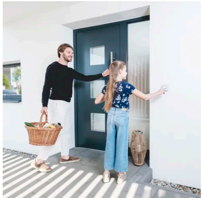
Der Fingerprint ist kinderleicht zu bedienen – bereits Kinder ab sechs Jahren können ihn einfach benutzen.

Wie auch bei der ekey dLine, kommt bei den neuen Fingerprint-Generationen für Unter- und Aufputz sowie Sprechanlagen und Hohlräume ein Flächensensor zum Einsatz. Damit entsprechen sie dem aktuellen Stand der Technik, den User bereits aus ihrem Alltag, wie etwa vom Smartphone, kennen. Die Bedienung des Fingerprints erfolgt durch die benutzerfreundliche Touchbedienung intuitiv. Durch die laufende Verwendung lernt der Fingerprint mit, somit stellen kleine Verletzungen am Finger oder das Wachstum von Kinderfingern kein Problem dar. Der patentierte ekey-Algorithmus wurde für die zukunftssichere Sensortechnologie optimiert.